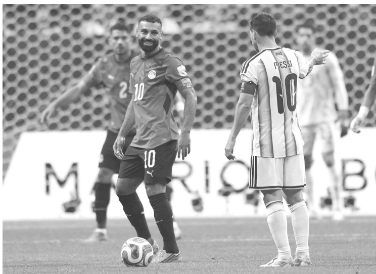
► Después del duelo comenzó a circular la toma de televisión de la acción desde la perspectiva de la Star Player Cam. Reforma