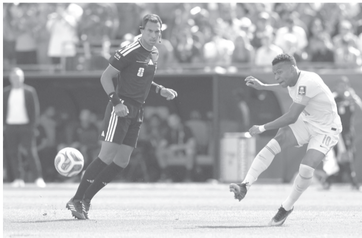
► Tritura Francia sueños de Marruecos y va a semifinales tras ganar el encuentro.

En el minuto 28, Francia tuvo otra oportunidad desde el punto penal. Mbappé fue el encargado de cobrar, pero Yassine Bono adivinó la dirección del disparo y atajó el remate para mantener el empate sin