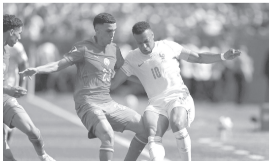
► Con goles de Kylian Mbappé y Ousmane Dembélé, Francia derrotó por 2-0 a Marruecos y avanzó a las semifinales.