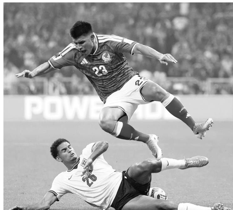
► La decisión de la FIFA llega en un momento de intenso debate sobre los criterios disciplinarios del torneo.

Ahora, Inglaterra deberá buscar soluciones para mantener firme su defensa en la recta final del mundial.