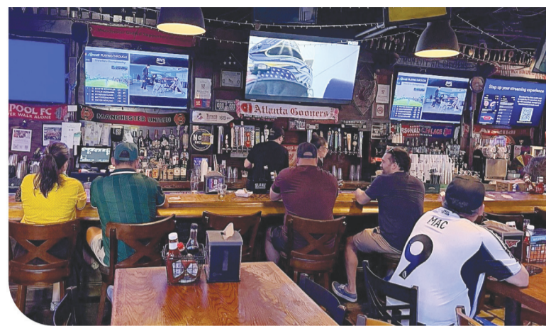
Con el escudo del Arsenal al centro y decenas de pantallas, el bar ofrece una atmósfera única.