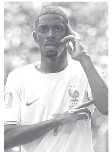
► Con esto, los galos esperan a España o Bélgica en el juego por el pase a la final.