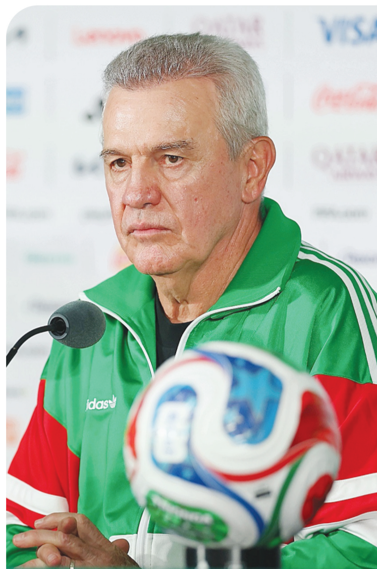
■ Aguirre cree que el Tri está en buenas manos con Rafa Márquez.

El "Vasco" dijo que México queda en buenas manos con el técnico Rafael Márquez, quien es una amalgama de grandes entrenadores como Pep Guardiola y Ricardo La Volpe.