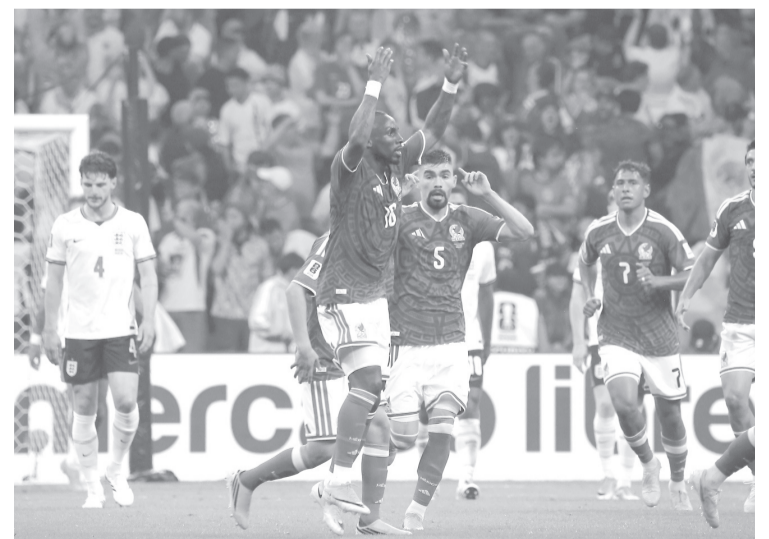
► México se convirtió en la segunda selección anfitriona de este mundial en quedar fuera.

buscarán un lugar entre los cuatro mejores del Mundial 2026, en una fase que promete enfrentamientos de alto nivel y candidatos cada vez más firmes al campeonato.