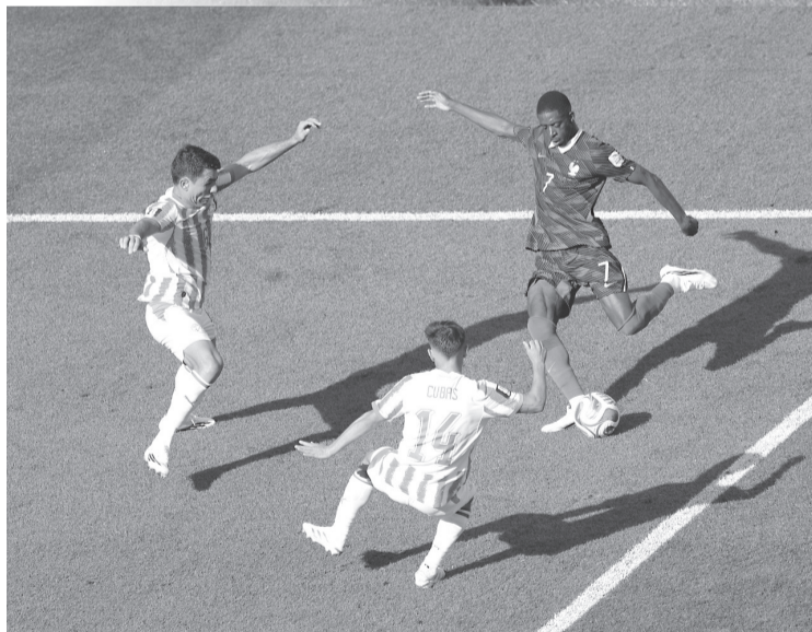
► Francia logró avanzar al derrotar a Paraguay, pero su boleto estuvo complicado de conseguir.

escandinavo y prolongó la sequía de la Verdeamarela, que nuevamente quedó lejos de la conquista del título mundial.