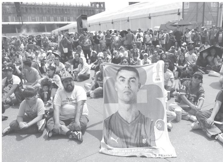
Apenas acabó el encuentro aparecieron las lágrimas, los abrazos largos y las caras de tristeza de quienes esperaban ver a “CR7” consumir su carrera con un título más. Reforma

Por un lado, quienes apoyaban a los lusitanos vestían playeras con el nombre de Cristiano en el dorsal; por otro, los españoles apoyaban a la estrella