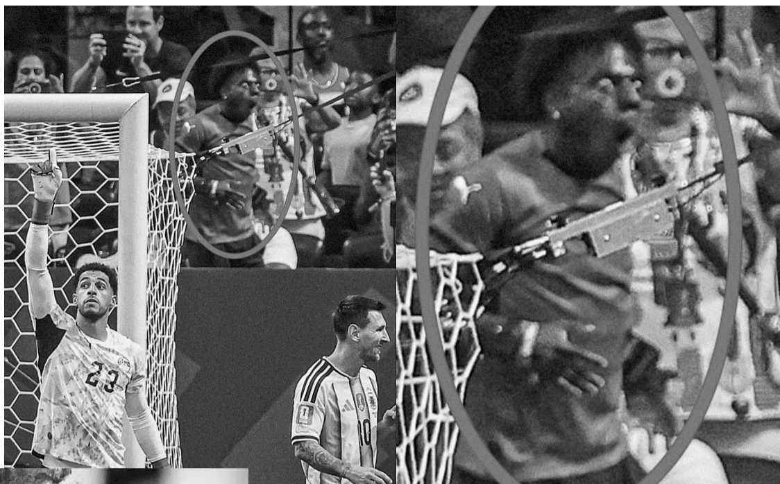
► Las cámaras captaron al streamer estadounidense, y admirador de Cristiano Ronaldo, detrás de la portería.