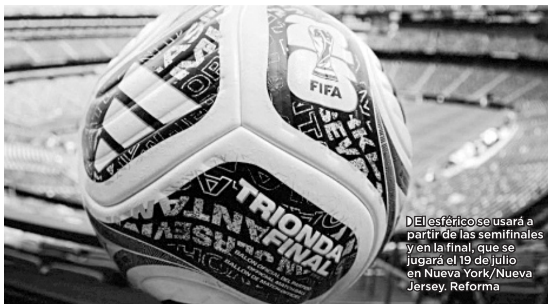
Del esférico se usará a partir de las semifinales y en la final, que se jugará el 19 de julio en Nueva York/Nueva Jersey. Reforma

tos de final desde el lunes, mientras que Argentina hizo lo propio este martes frente a Egipto. Lo que es un hecho es que uno de los encuentros más esperados sea la carta de presentación de