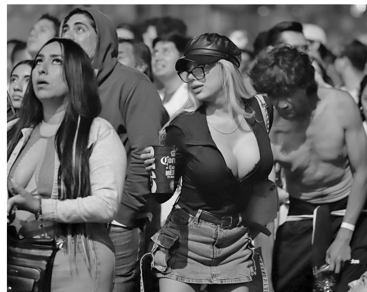
► Para algunos asistentes, la decisión prioriza la seguridad en el centro mundialista instalado en el Zócalo. Agencias