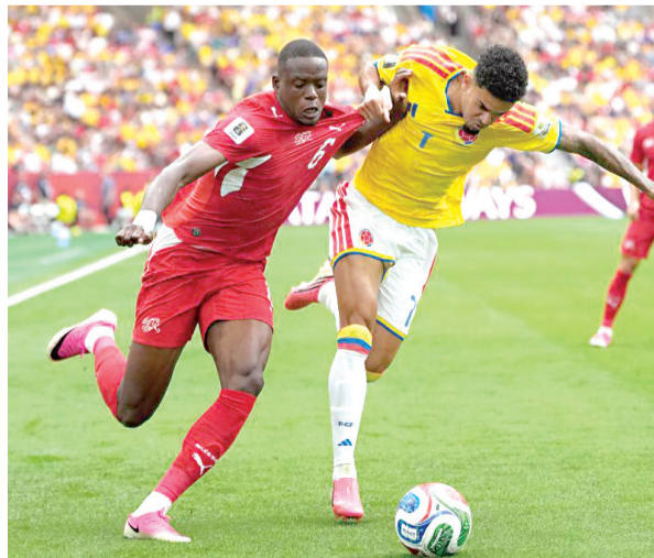
La selección suiza mostró solidez defensiva y sangre fría en los penales para asegurar su boleto a los cuartos de final, en los que enfrentará a Argentina.