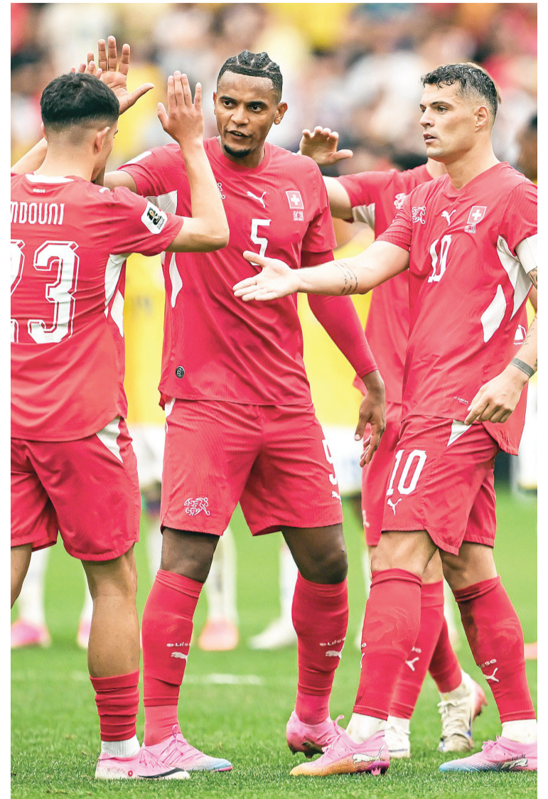
Suiza celebró su clasificación a los cuartos de final tras vencer a Colombia en la tanda de penales.