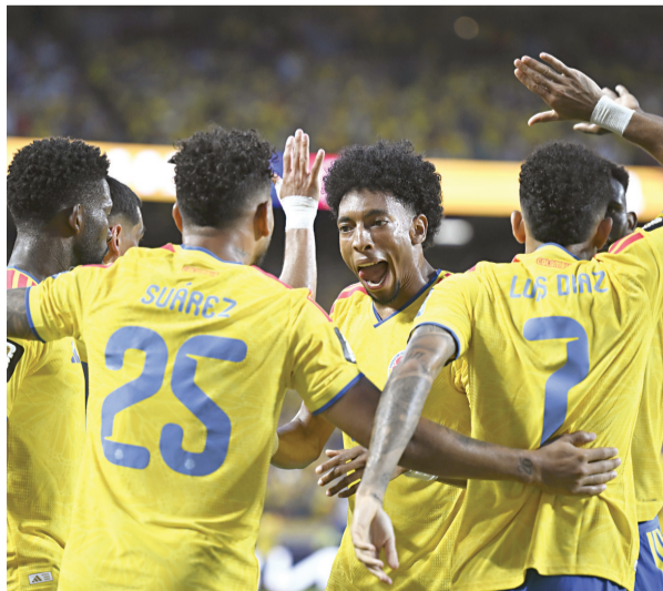
Colombia logró mantenerse sólido durante el tiempo reglamentario, pero no pudo romper las redes del arquero rival.

En el segundo tiempo suplementario, Xhaka volvió a intentar desde fuera del área, mientras que al minuto 115 Campaz dejó escapar la ocasión más clara al enviar desviado su intento dentro del área.