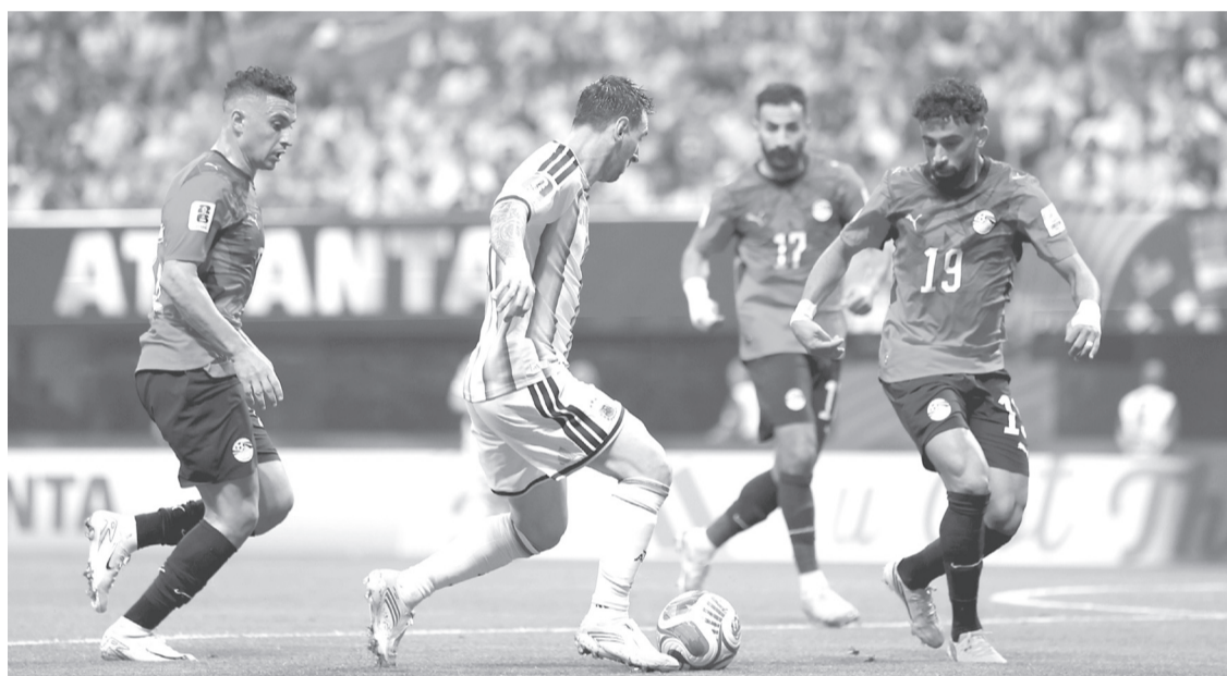
La Albiceleste mantiene vivo el sueño del bicampeonato y ahora espera rival para continuar su camino en la defensa del título.

Fue luego de otro contragolpe fulminante comandado por Haissem Hassan, del español Oviedo, que resolvió Zico con un remate cruzado que no le dio opciones al arquero Emiliano Martínez, pero el árbitro, advertido por el VAR, volvió