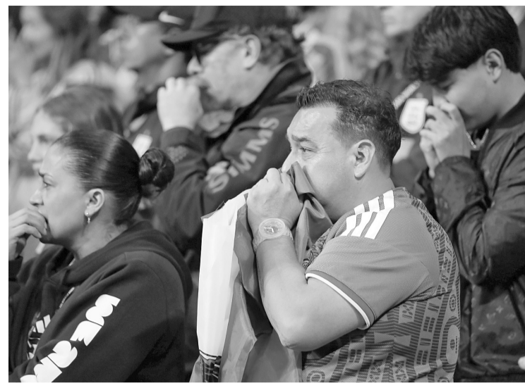
Las investigaciones detectaron que mientras se desarrolla el encuentro, los reportes pueden disminuir momentáneamente; sin embargo, comienzan a incrementarse una vez que termina el partido. Reforma