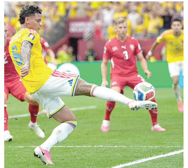
El empate sin goles llevó el partido al tiempo extra.