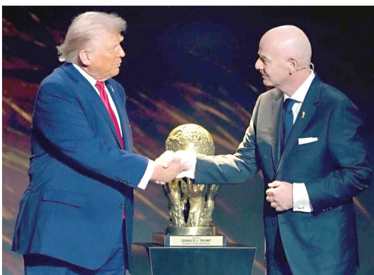
Infantino negó haber intervenido ante el organismo que posteriormente emitió un comunicado confirmando este hecho y explicando la decisión de levantar la suspensión de Balogun.

victoria de los Diablos Rojos, la federación publicó un mensaje con un comentario mordaz: "A ver quién supera esto".