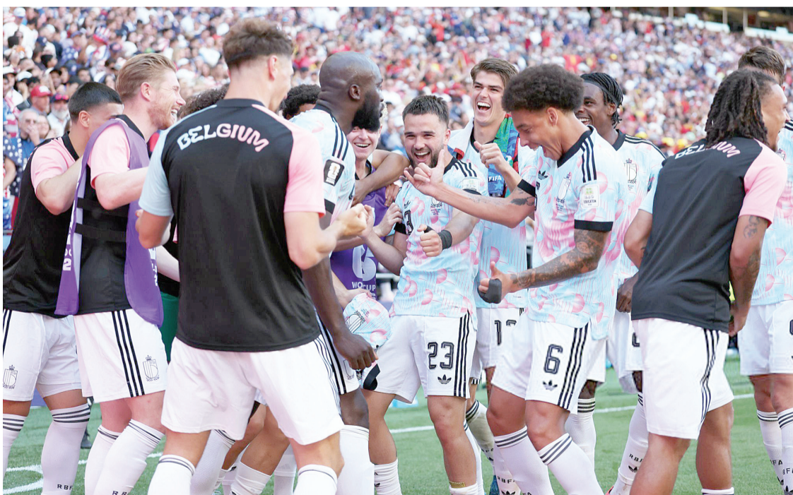
Varios futbolistas del combinado europeo aprovecharon el momento para recrear el característico baile de Donald Trump.

Varios futbolistas del combinado europeo aprovecharon el momento para recrear el característico baile de Donald Trump, un gesto que no pasó desapercibido debido al contexto que rodeó el partido.