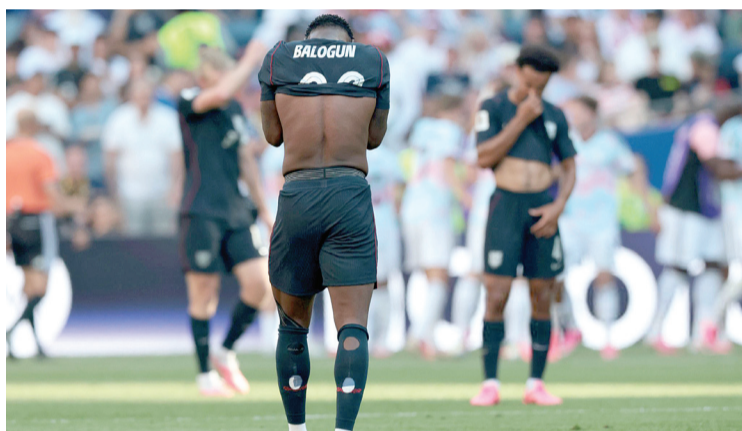
La eliminación de la selección estadounidense restó algo de trascendencia deportiva al caso, pero fue bien recibida en general fuera de Estados Unidos.

Donald Trump realizó un ingreso temerario en el ámbito del campeonato mundial de Fútbol con el "asunto Balogun". Sin embargo, lejos de ayudar al equipo de su país o al propio Folarin Balogun, su maniobra desató una indignación inmediata, seguida de una ola de satisfacción por la eliminación de Estados Unidos y la humillación parcial de aquel país que se identifica con la iniciativa del