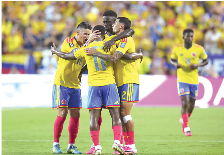
Colombia luchó hasta el final, pero cayó 4-3 en penales y se despidió del Mundial 2026 tras un intenso duelo en octavos de final.

Suiza salió con mayor intensidad para el segundo tiempo. Al 48, Ndoye desbordó y asistió a Djibril Sow, quien remató incómodo. Cuatro minutos más tarde, Rieder cobró un tiro libre que pasó apenas por un costado. Colombia re-