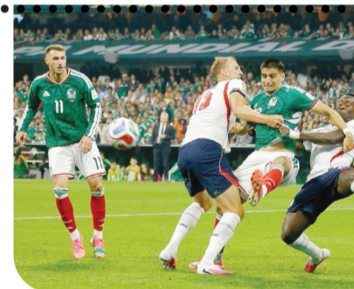
■ Solo 5 de los 20 remates del Tri fueron a puerta.

Para el segundo tiempo Javier Aguirre metió a Santi Giménez y a Guillermo Martínez, pero ninguno de los dos hizo daño real, y Santi ni siquiera terminó el juego, pues se lesionó un tobillo.