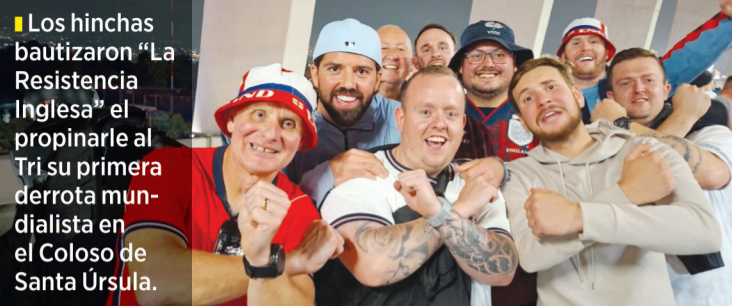
Los hinchas bautizaron "La Resistencia Inglesa" el propinarle al Tri su primera derrota mundialista en el Coloso de Santa Úrsula.