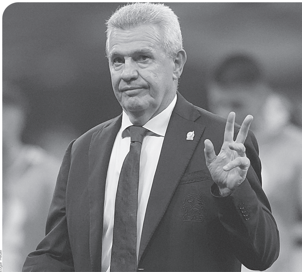
■ Javier Aguirre se despidió de la afición que se dio cita en el Estadio CDMX.