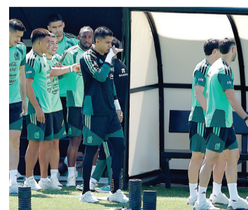
■ Una mañana del 6 de julio en la que, tras el cierre de la concentración, la vida en México comienza a retomar su curso.

Esa decena de jugadores dejará el Centro de Alto Rendimiento, ubicado cerca de la caseta de Tlalpan, donde la tarde del día anterior decenas de aficionados formaron un pasillo humano para despedir al equipo y enviar, desde el inicio del trayecto rumbo al estadio Azteca, su respaldo y buenas vibras.