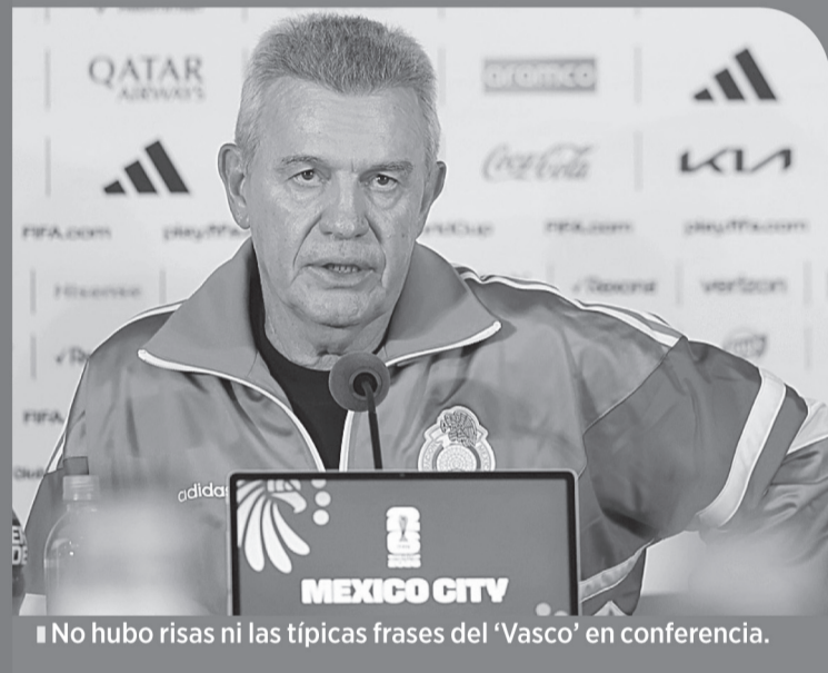
■ No hubo risas ni las típicas frases del 'Vasco' en conferencia.

Antes de irse, admitió que hubo abrazos y sus mejores deseos para los jugadores que seguirán con esta historia.