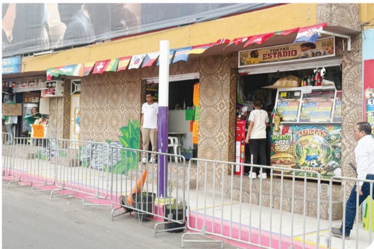
Los negocios alrededor del Estadio Ciudad de México lamentaron que se termine la fiesta.

“Se terminó la fiesta. Nos ayudó mucho el Mundial, la neta, entraban 500-600 personas al baño en los días de partido, eran unos 6 mil pesos”, dijo Rómulo, un señor que abrió las puertas de su casa en las calles aledañas para brindarles a los fans el servicio de WC.