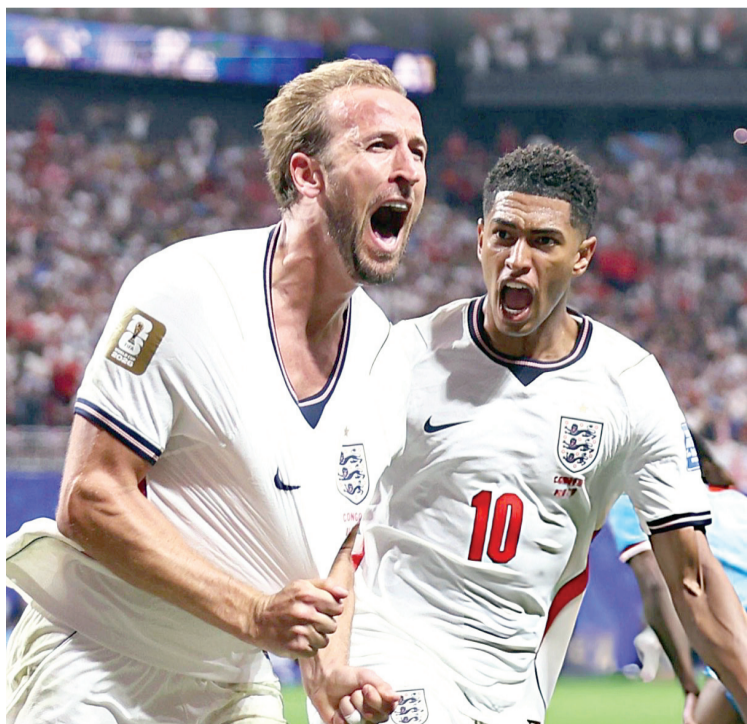
► Jude Bellingham y Harry Kane aprovecharon las graves fallas del Tri y fueron los autores de los tantos ingleses.

Tras la pausa de hidratación de la segunda parte, México fue incisivo ante una Inglaterra que por momentos la pasó mal atrás. Los últimos minutos la desesperación hizo estragos