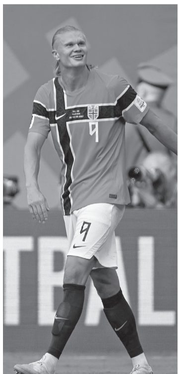
► Haaland, que había tenido un partido discreto, apareció con un cabezazo al minuto 79'. Volvió a aparecer con un tiro de afuera del área al 90'.

Brasil adelantó líneas en busca de la igualdad y dejó espacios que Noruega aprovechó