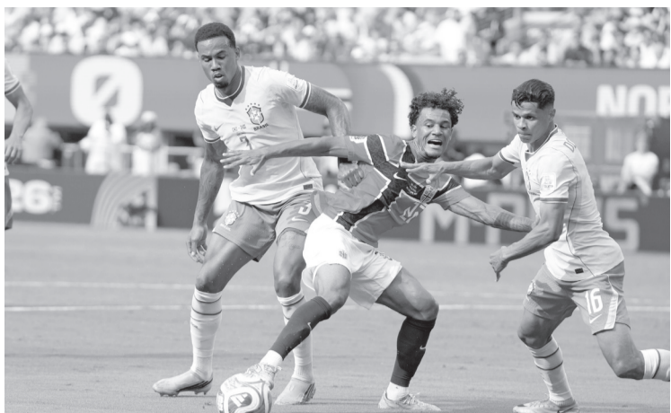
► Brasil no tuvo contundencia durante casi todo el partido y lo pagó. Aunque tuvieron oportunidades, no logró descifrar la portería.