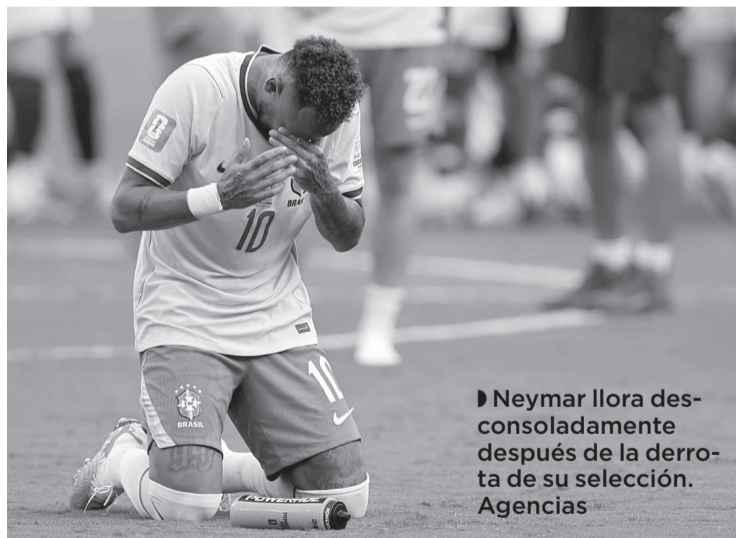
► Neymar llora desconsoladamente después de la derrota de su selección.

tos en las ediciones recientes y continúan sin volver a disputar una Final desde 2002. La derrota se suma a otros capítulos dolorosos de su historia, como la eliminación sufrida ante Alemania en el recordado 7-1 del Mundial de 2014, celebrado en casa.