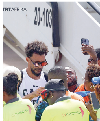
Los aficionados incluso citaron expresiones grandilocuentes en alusión al aniversario número 51 de la independencia del país.

“Que empiece el desfile”, reza la descripción de uno de los videos, mientras que los medios locales muestran fotos de autos y motos alineados detrás del autobús del equipo, en una noche de alegría para toda la nación, que jamás olvidará la campaña en el Mundial 2026.