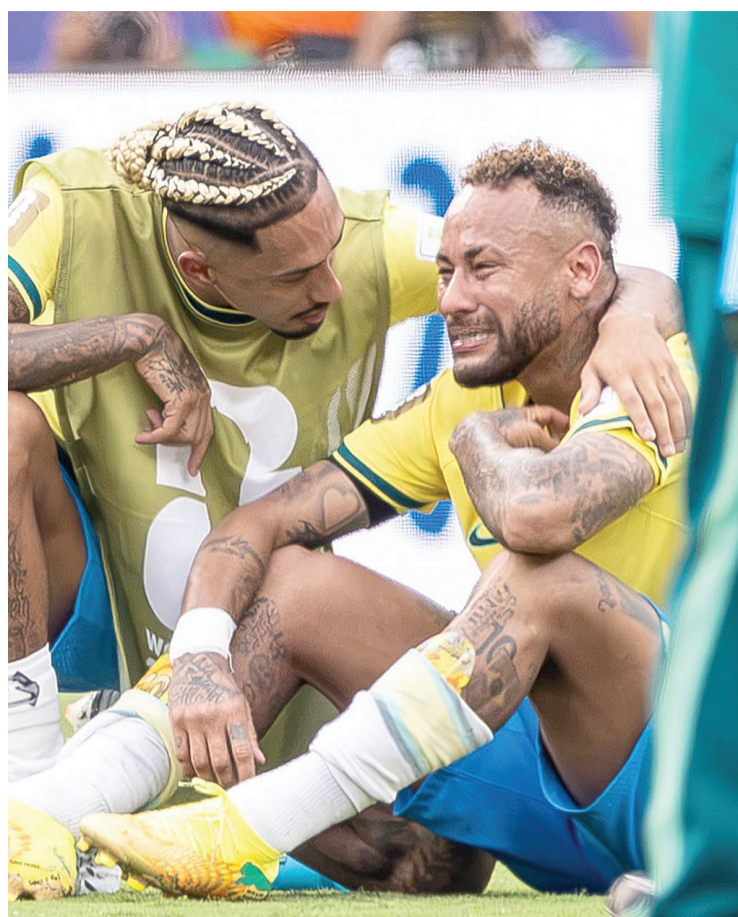
El atacante del Santos de su país, de 34 años, entró a la convocatoria brasileña de último momento, aunque una lesión no le permitió rendir como se esperaba en la justa. Agencias

saje de Brasil tras su eliminación de la Copa del Mundo?