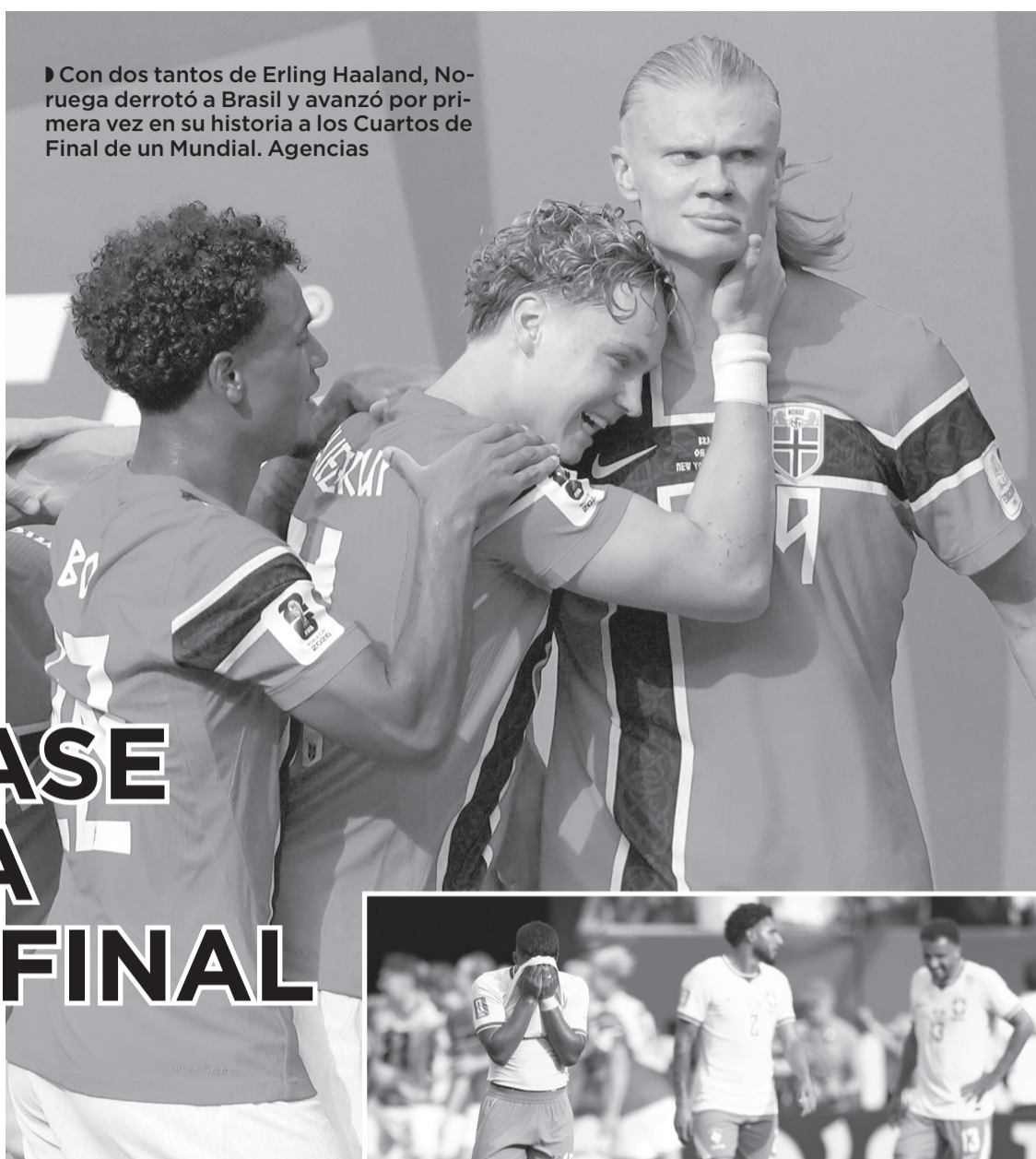
► Con dos tantos de Erling Haaland, Noruega derrotó a Brasil y avanzó por primera vez en su historia a los Cuartos de Final de un Mundial.