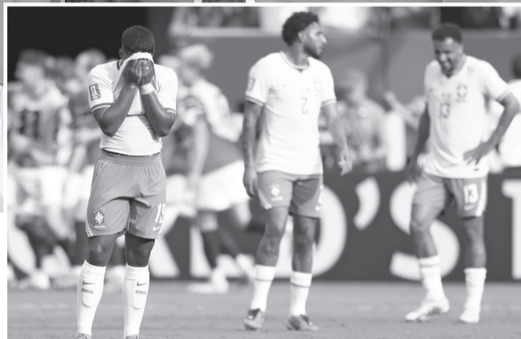
► Los pentacampeones suman otro fracaso luego de que en las últimas ediciones se quedaron en Cuartos y en 2014, donde fueron sede, fueron eliminados por Alemania.

Con esta eliminación, Brasil vuelve a quedarse lejos del objetivo de conquistar su sexto título mundial. Los pentacampeones acumulan una nueva frustración tras caer en Cuar-