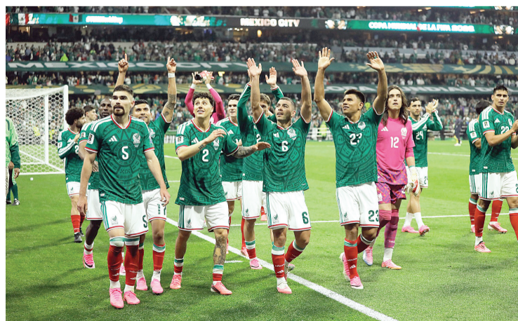
► México se despide del Mundial, en su estadio y con su gente.