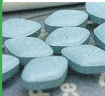
■ Podrían administrarse sildenafil.