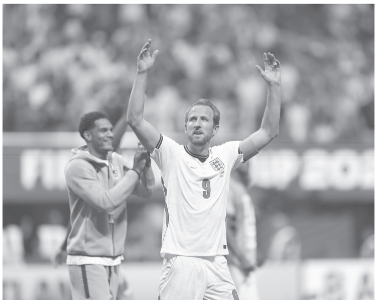
■ Harry Kane juega a 520 metros sobre el nivel del mar, en Múnich. 22 de sus compañeros no lo hacen a más de 170, en la Premier League.

“Honestamente, si me lo permiten, habría volado directamente desde el último partido a la altitud. Cuatro días o más, y es lo que haría, evitaría llegar 2 días antes. Mala noticia para los aficionados, están eligiendo volar viernes por la tarde para un partido el domingo por la noche ¿Qué significa eso? 2 días exactos”, explicó en un artículo en su perfil de Substack.