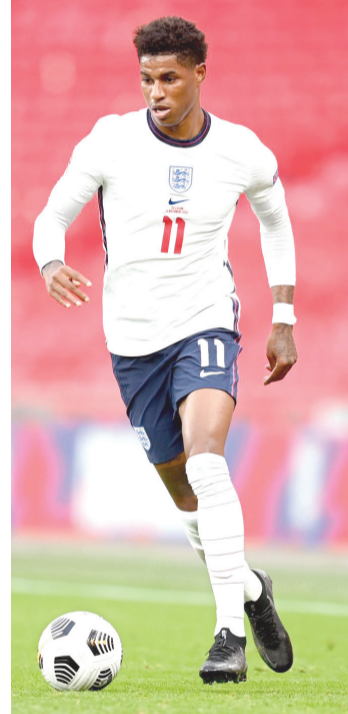
■ Rashford fue titular en el último partido de Inglaterra.