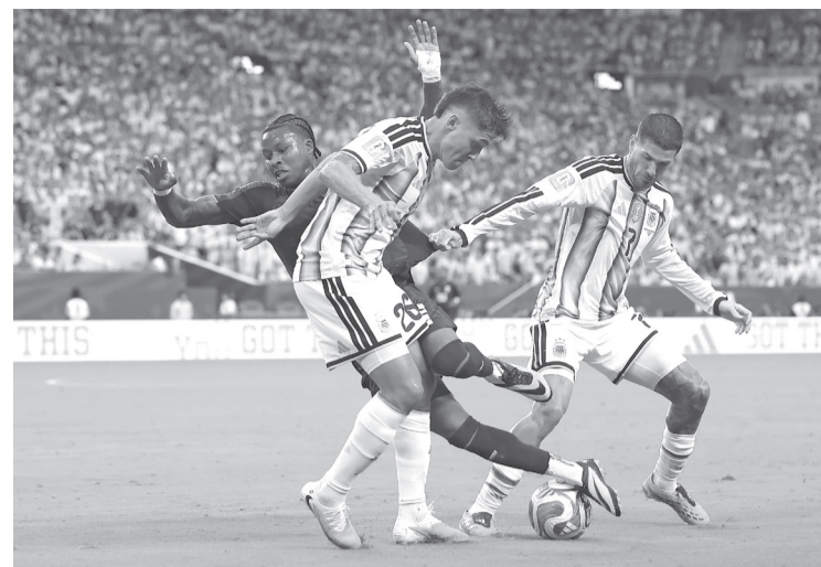
Cuando todo apuntaba a la tanda desde los once pasos, Argentina encontró el gol de la victoria.

El empate persistió durante el tiempo reglamentario, obligando a disputar la prórroga. Fue entonces cuando Lisandro