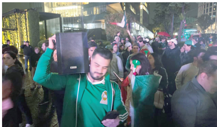
Los ingleses quieren evitar el desvelo en la Ciudad de México.

Ahora, la Federación también está consciente que esa información se filtrará, y más porque Inglaterra llegará a Toluca y después será resguardado