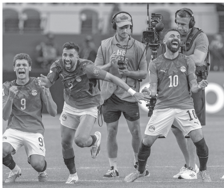
Ninguno de los dos equipos logró romper el empate en el tiempo extra, por lo que el boleto se definió desde los once pasos. De esta manera Egipto avanza a la siguiente etapa. Reforma

mostró su mejor versión física, fue determinante para el funcionamiento ofensivo de su equipo y mantuvo la calma al convertir su penal. Egipto do-