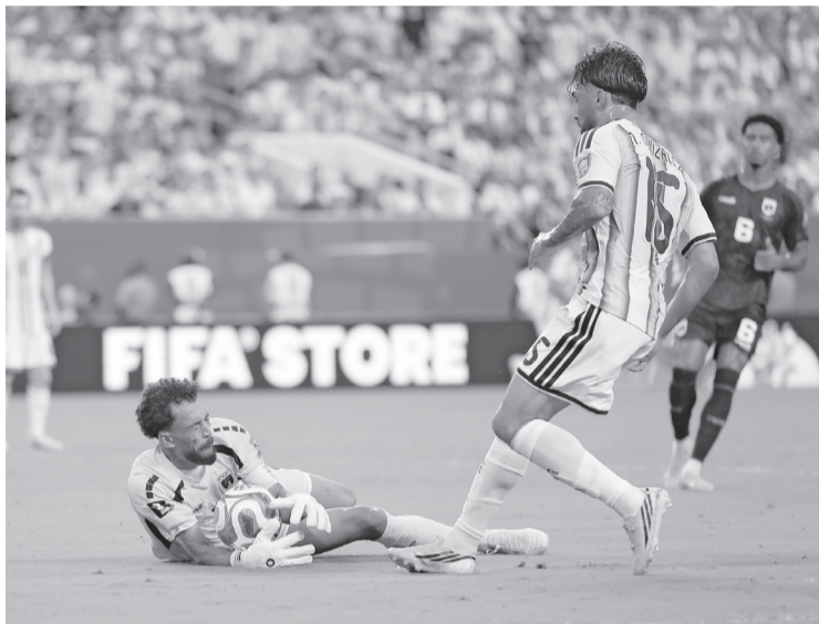
La Albiceleste avanzó a Octavos con un triunfo 3-2, pero Cabo Verde conquistó corazones al llevar al campeón del mundo al límite en Miami.

En la segunda mitad, Cabo Verde mostró personalidad y encontró el premio a su insis-