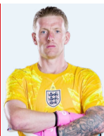
1 JORDAN PICKFORD