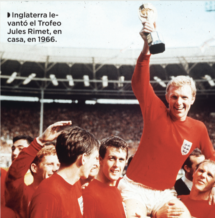
► Inglaterra levantó el Trofeo Jules Rimet, en casa, en 1966.

Inglaterra fue subcampeona en las más recientes ediciones de la Eurocopa de Naciones, en 2020 y 2024, y desperdició una ocasión mayúscula de ganar el torneo que le tocó organizar en 1996, al quedarse en Semifinales.