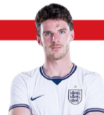
4 DECLAN RICE

Se adapta a las variantes que ejecuta Tuchel.