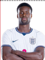
6 MARC GUEHI

Es de los fijos en el esquema de Tuchel por la seguridad que da en su sector, la marca pegajosa sobre el punta rival y la posibilidad de dar salida desde su sector. Prácticamente no ha tenido complicaciones y es de los más destacados.