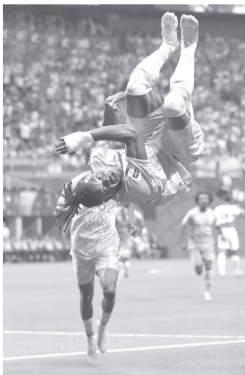
Los del Congo tomaron ventaja temprano en el duelo con anotación al minuto 7 del encuentro.

blica Democrática del Congo y avanzar a octavos de final del Mundial 2026.