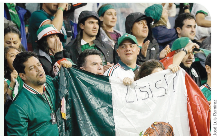
El "¿Y si sí?" se escuchó en cada rincón del estadio.

Y así, con mucho corazón, el grupo de animación logró su cometido porque en el segundo tiempo el contagio fue total y el "¿y si sí?" resonó en cada rincón.