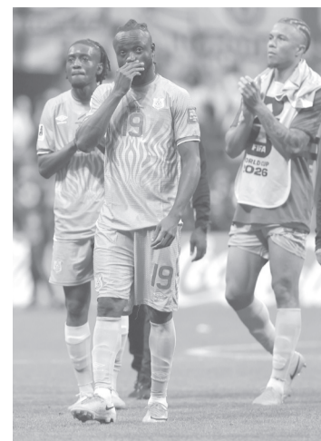
Congo trató de sumarse al frente para conseguir el empate, pero ya sin fuerza al ataque y sin mucha idea.

En un encuentro complejo para el cuadro británico, Harry Kane apareció para sacar adelante a los suyos