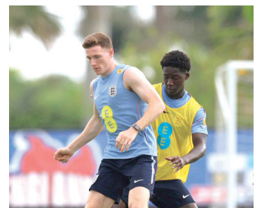
El conjunto dirigido por Thomas Tuchel tendrá su última práctica el sábado.