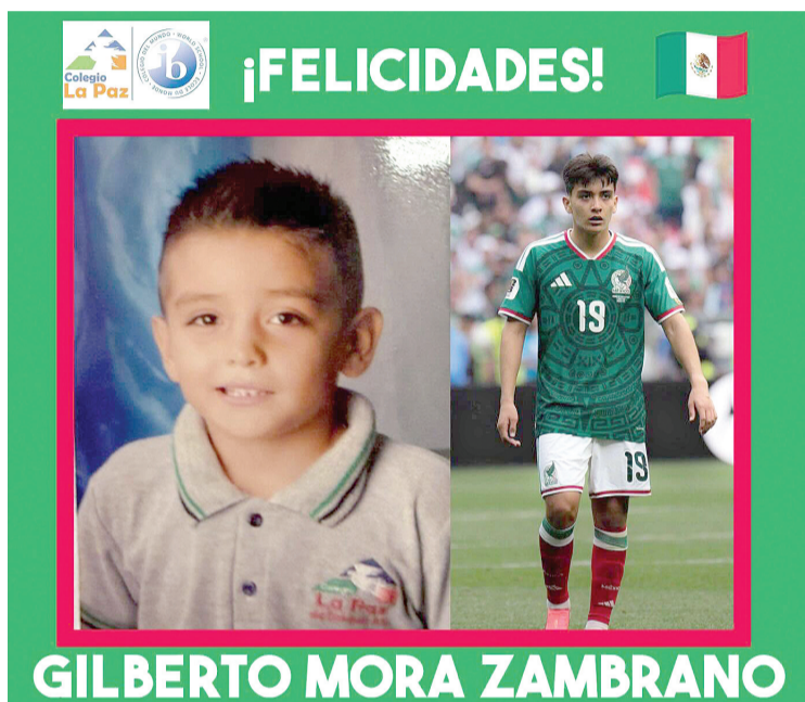
► Mora se desempeña como mediocampista ofensivo y en el presente mundial ha ganado proyección y el reconocimiento de la afición internacional.

Este miércoles, el Colegio La Paz de Chiapas, ubicado al sur oriente de la capital (próximo a Copoya), destacó con orgullo el