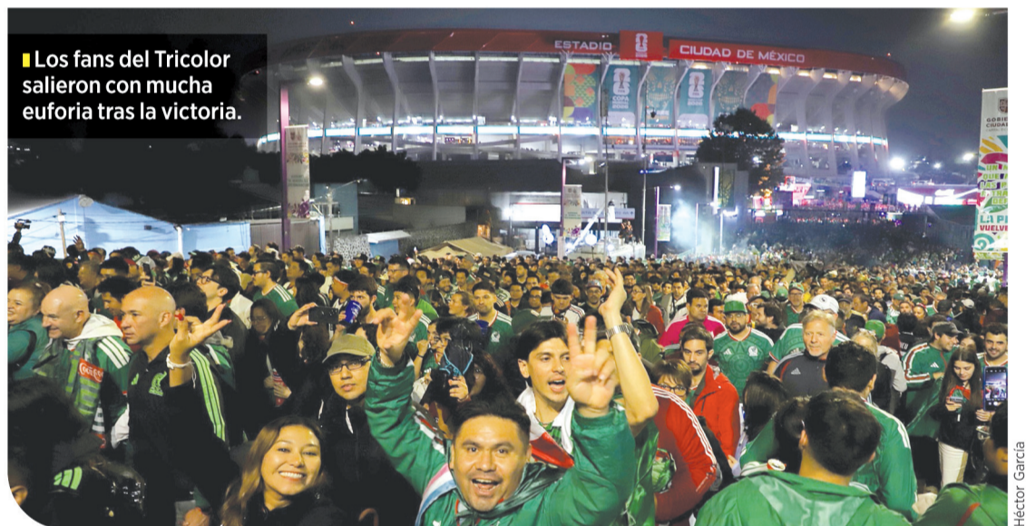
Los fans del Tricolor salieron con mucha euforia tras la victoria.