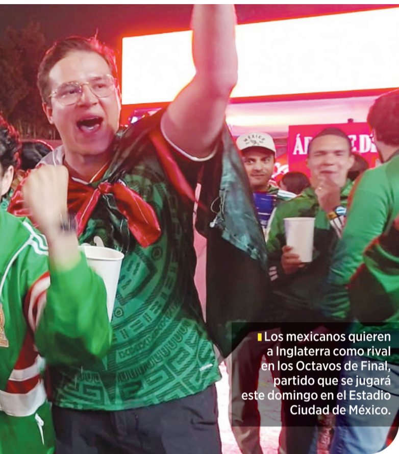
Los mexicanos quieren a Inglaterra como rival en los Octavos de Final, partido que se jugará este domingo en el Estadio Ciudad de México.