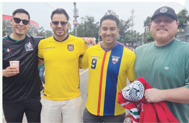
Los cuatro amigos de la infancia felices de presenciar el partido.