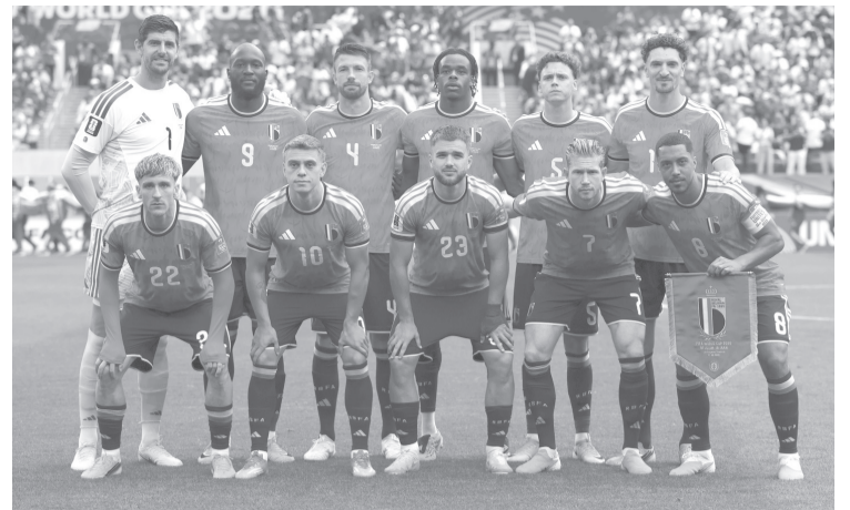
Los Diablos Rojos parten como favoritos, pero los Leones de la Teranga llegan con argumentos para pelear por el pase en un atractivo enfrentamiento. Agencias

En ese contexto, los del Congo intentarán repetir esa actuación, consciente de que necesitará un partido casi perfecto para avanzar. “Estamos ante un partido muy difícil pero no es insuperable, nos hemos enfrentado a equipos que en el papel eran superiores a nosotros y logramos competirles. En una eliminatoria cualquier cosa puede pasar. Conocemos muy bien a la selección de Inglaterra. No podemos cometer errores ante este tipo de equipos”, señaló el entrenador del conjunto africano.