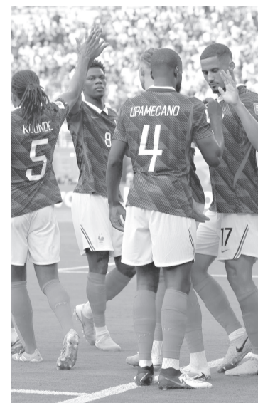
► Kylian marcó el tercero al minuto 74, tras un gran pase filtrado por Olise, y prácticamente fusiló al portero sueco una vez más.

Con su doblete Mbappé llega a seis goles en este mundial y además se coloca con 18 tantos en la historia de las