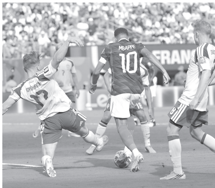
► Fue precisamente Mbappé quien puso adelante a los franceses cerca del final del primer tiempo.

KYLIAN MBAPPÉ (45', 74' FRA) BRADLEY BARCOLA (53' FRA)