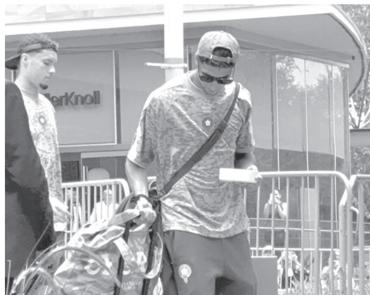
► Achraf Hakimi fue de los más vitoreados a la salida del equipo.

ron Achraf Hakimi, Issa Diop y el arquero Yassine Bounou, quienes respondieron con saludos a las muestras de cariño