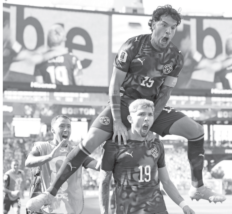
Ambas escuadras buscaron el gol, pero este ya no cayó, por lo que los penales se hicieron necesarios. Agencias