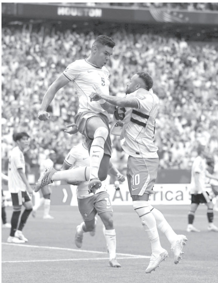
La insistencia encontró premio al minuto 56, cuando Casemiro apareció para empatar el marcador con un remate que devolvió la confianza al conjunto sudamericano y cambió el rumbo del partido.

CASEMIRO (56' BRA) GABRIEL MARTINELLI (90+6' BRA) KAISHU SANO (29' JAP)