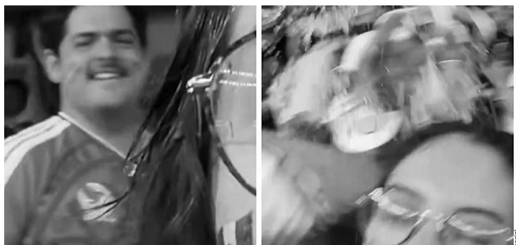
Durante el duelo entre Chequia y Corea del Sur, la creadora de contenido conocida como Inocat estaba filmando el ambiente cuando un aficionado hizo señas racistas.

Desafortunadamente, el recinto capitalino suma otros incidentes cuestionables, como el que ocurrió en el encuentro entre Colombia y Uzbekistán, en el que un aficionado del país