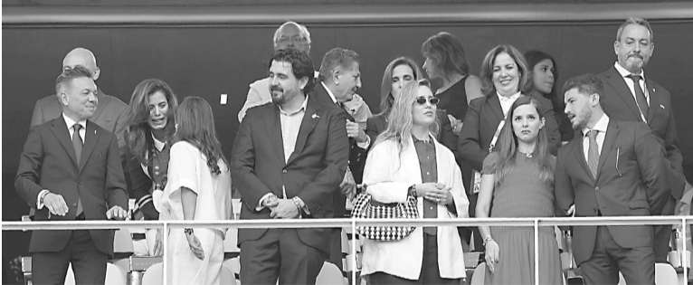
El Gobernador Pablo Lemus, junto al dueño de las Chivas y del estadio, Amaury Vergara, así como el Gobernador de NL, Samuel García.