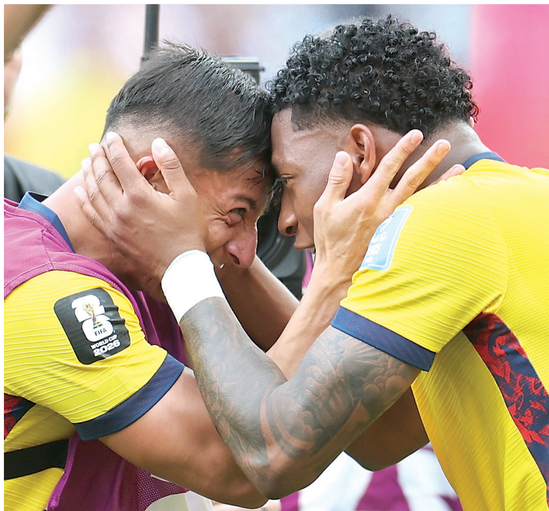
Los ecuatorianos gozan de la mejor generación de futbolistas de su historia: Piero Hincapié (Arsenal), Willian Pacho (PSG), Moisés Caicedo (Chelsea) y Gonzalo Plata (Flamengo), por mencionar algunos.

Los dirigidos por Javier Aguirre se verán las caras con