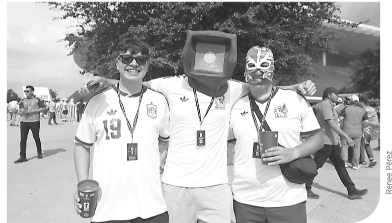
La afición le puso color a las tribunas del Estadio Guadalajara.

El silbatazo final marcó el adiós del Estadio Guadalajara como sede mundialista, pero no apagará la pasión de una Ciudad muy futbolera.