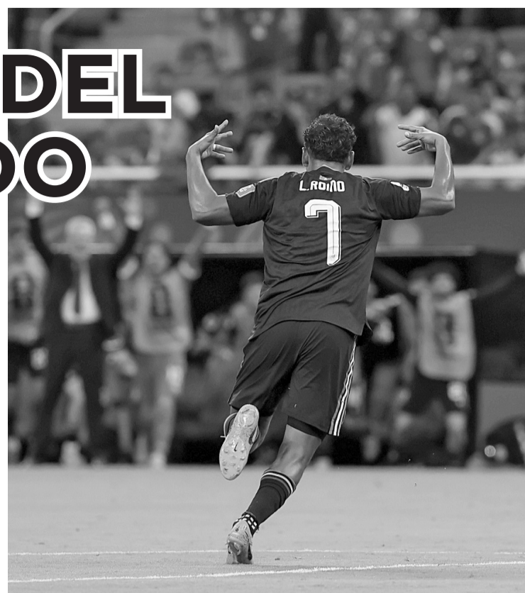
El "jersey" negro del tercer uniforme de la selección nacional está agotado.