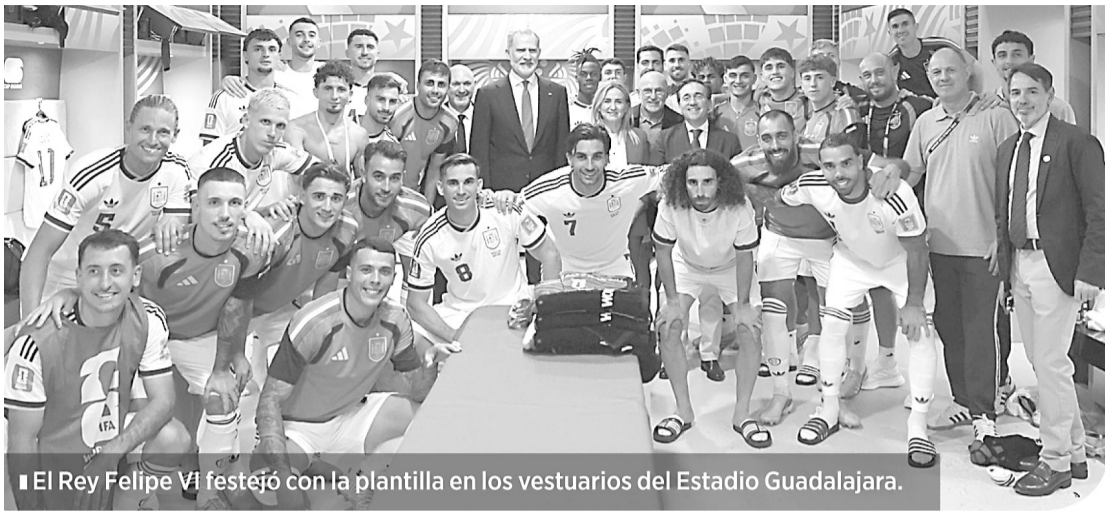
El Rey Felipe VI festejó con la plantilla en los vestuarios del Estadio Guadalajara.