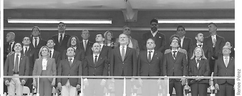
El Rey Felipe VI, junto a los federativos de la RFEF, además de Casillas, Puyol, Hierro, Salgado, Sebastián Abreu y Jorge Campos.