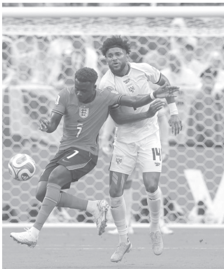
El cuadro de los Tres Leones sumó 7 puntos y se instaló en los dieciseisavos de final de la justa mundialista. Reforma

Panamá también encontró algunos espacios para inquietar el arco defendido por