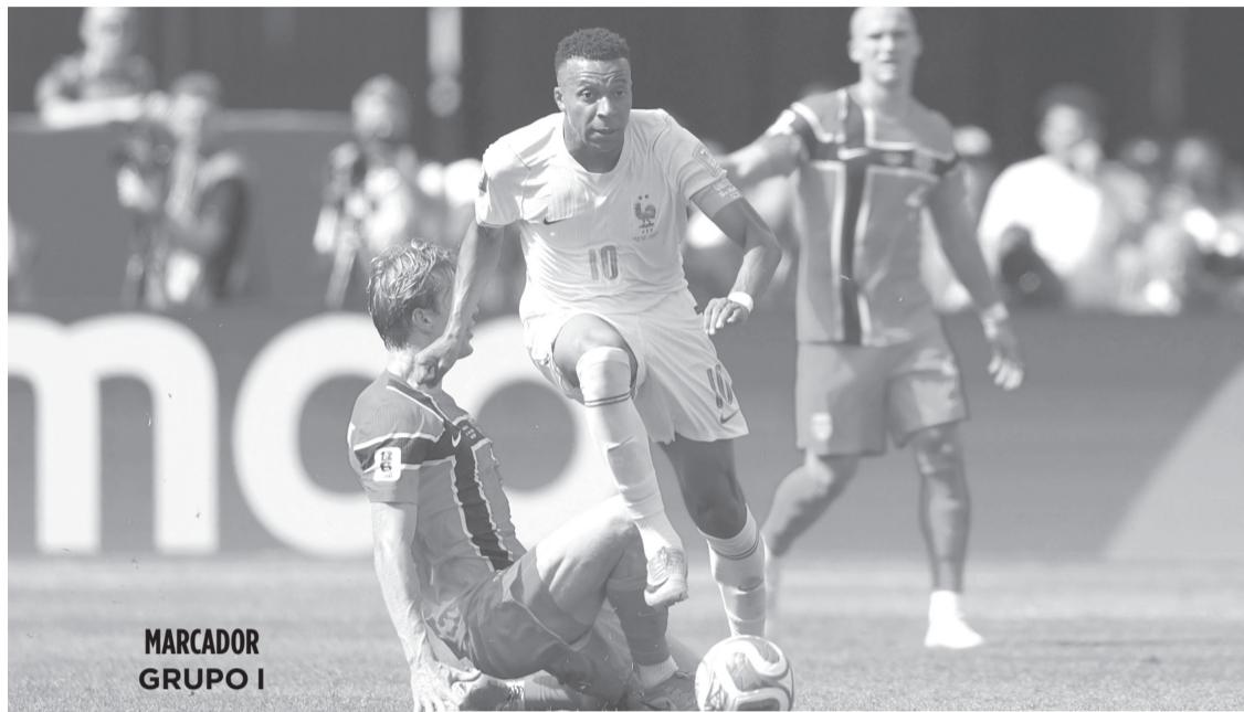
MARCADOR GRUPO I

Dembélé abrió su concierto con un tiro cruzado y sorpresivo para el arquero Egil