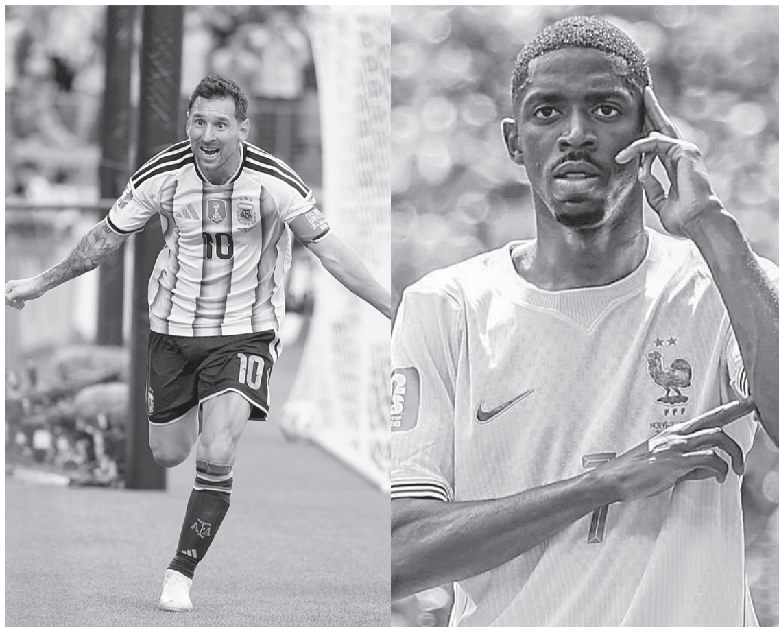
En esta edición del certamen, Messi se estrenó con un triplete en contra de Argelia; el partido justamente quedó 3-0 a favor de los actuales campeones.