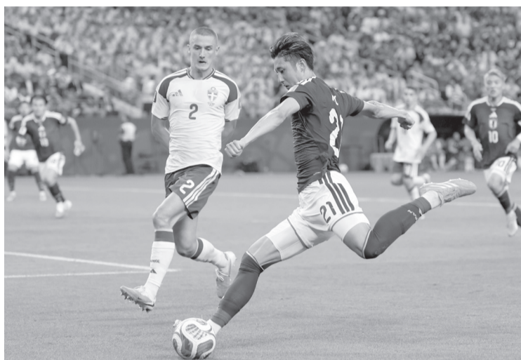
► Japón tomó la iniciativa en los primeros minutos, mostrando su estilo característico de presión alta y transiciones rápidas.

Japón tomó la iniciativa en los primeros minutos, mostrando su estilo característico de presión alta y transiciones