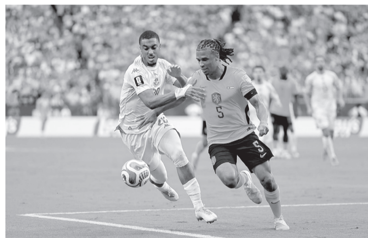
► El encuentro terminó en manos de Países Bajos, que se impuso 3-1 a Túnez y aseguró la primera posición del sector.