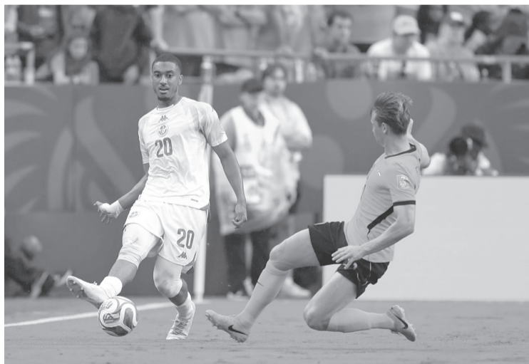
► En la segunda mitad, Países Bajos bajó el ritmo y lo terminó pagando al 54.

Desde el primer minuto, Túnez intentó sorprender con un remate de Gharbi que se marchó por encima del arco. Sin embargo, el inicio del partido se torció rápidamente para los africanos: al 3', un despeje desafortunado de Ellyes Skhiri terminó en autogol y puso en ventaja a la Naranja Mecánica. El golpe fue inmediato y, apenas cuatro minutos después, Brian Brobbey amplió la diferencia al 7', en un arranque fulminante que dejó a Túnez