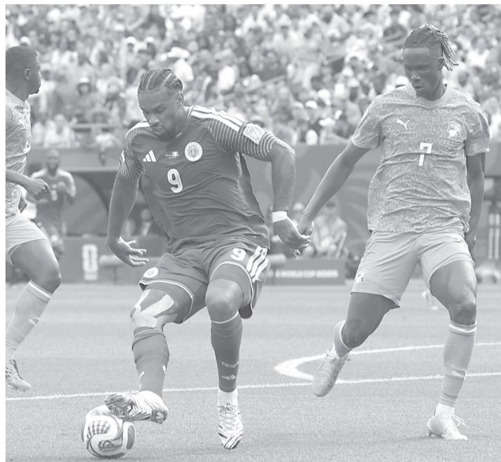
De momento, el conjunto africano enfrentaría a Noruega en los dieciseisavos de final, con la ilusión de seguir avanzando en una Copa.

En la parte complementaria, Costa de Marfil recuperó el control del encuentro gracias a su solidez en el mediocampo y a la experiencia de sus jugadores más importantes. Con una ventaja mínima, el equipo africano manejó el ritmo del partido y esperó el momento indicado para sentenciar el