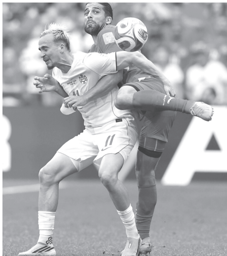
Los jugadores de Suiza celebran una victoria clave sobre Canadá que les aseguró el liderato del Grupo B en el Mundial 2026.

Canadá no bajó los brazos y reaccionó en busca de una remontada. El esfuerzo tuvo premio al minuto 76, cuando