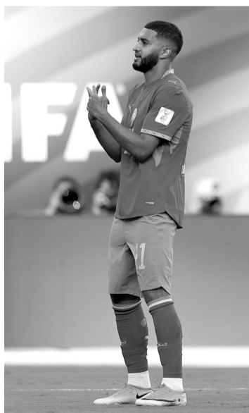
► Cuando era bebé, los médicos le diagnosticaron un problema congénito que no le permitía mantenerse parado y caminar en el futuro. Hoy es una de las figuras de Marruecos. Reforma

Hoy, a sus 25 años, es una de las figuras de Marruecos y ya marcó dos goles en sus primeros dos partidos de Copa del Mundo, para empatarle a