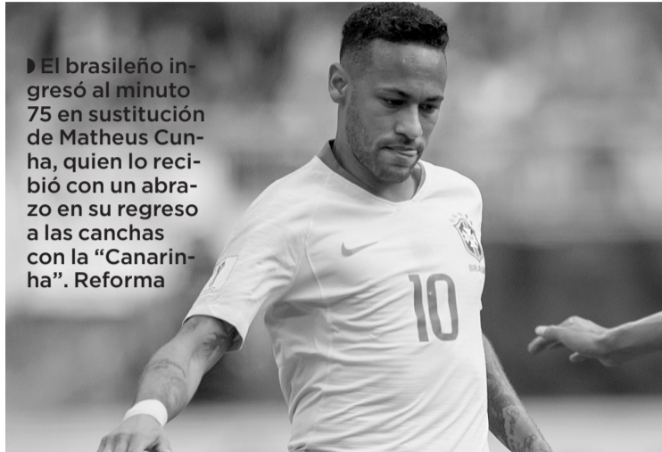
► El brasileño ingresó al minuto 75 en sustitución de Matheus Cunha, quien lo recibió con un abrazo en su regreso a las canchas con la "Canarinha". Reforma

lona y del Paris Saint-Germain ingresó al minuto 75 en sustitución de Matheus Cunha, quien lo recibió con un abrazo en su regreso a las canchas con la "Canarinha". De esta manera, Neymar volvió a vestir la camiseta de su selección tras 981