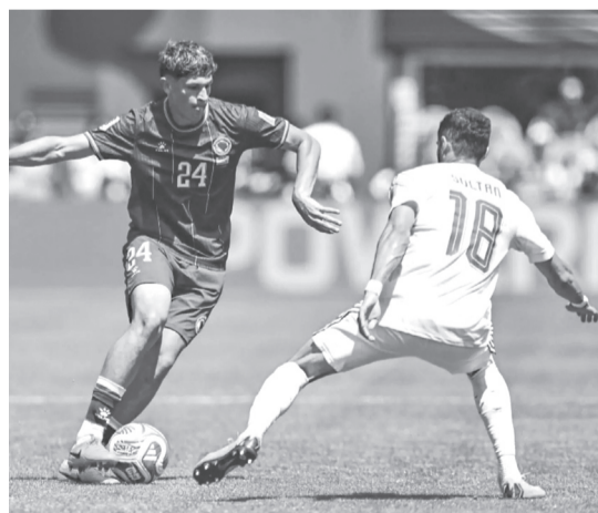
Bosnia concluye su participación mundialista con una actuación positiva, mientras que Catar se despidió del torneo sin poder cumplir las expectativas. Agencias

Bosnia aprovechó los espacios que dejó su rival en busca del empate y amplió la ventaja. La selección balcánica mostró mayor orden táctico y supo