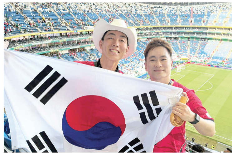
► Las grandes banderas coreanas fueron ondeadas por los seguidores.

Asimismo, la afición de ambos equipos estuvo concentrada en vallas para ingresar al estadio, en lugar de la unifila que se vio en los dos encuentros anteriores.