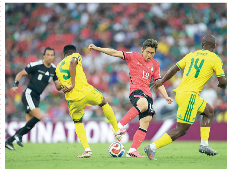
▶ Con este resultado los "Bafana bafana" suman 4 puntos y desplazan a Corea del Sur al tercer lugar con tres puntos, en tanto que Chequia se despidió del Mundial 2026.

La derrota además complica el panorama de Chequia, que queda prácticamente sin opciones de avanzar tras sus resultados previos, mientras el Grupo A queda liderado por la Selección Mexicana, que mantiene paso perfecto y encamina su clasificación a la siguiente ronda.