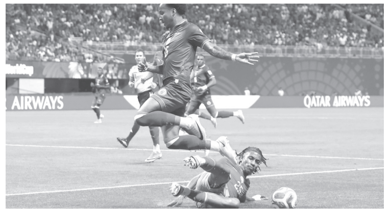
Vence Marruecos a Haití y avanza como segundo de grupo. Ahora debe esperar a que se defina el líder del Grupo F, que encabeza Países Bajos.

GOLES VINÍCIUS JR. (7' Y 45 + 3' BRA) MATHEUS CUNHA (60' BRA)