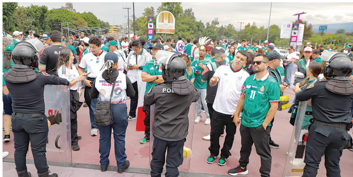
► La seguridad a tope en el estadio para garantizar que el encuentro se lleve a cabo de manera ordenada. Reforma

La mayoría ataviados con playeras verdes, algunos más