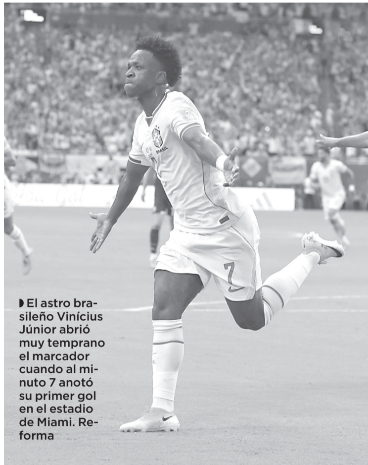
El astro brasileño Vinícius Júnior abrió muy temprano el marcador cuando al minuto 7 anotó su primer gol en el estadio de Miami.

Cuando el primer tiempo parecía cerrarse con ventaja mínima, Vinícius Jr. volvió a aparecer en el tiempo agregado (45 + 3') para firmar su doblete y encaminar el duelo a favor de