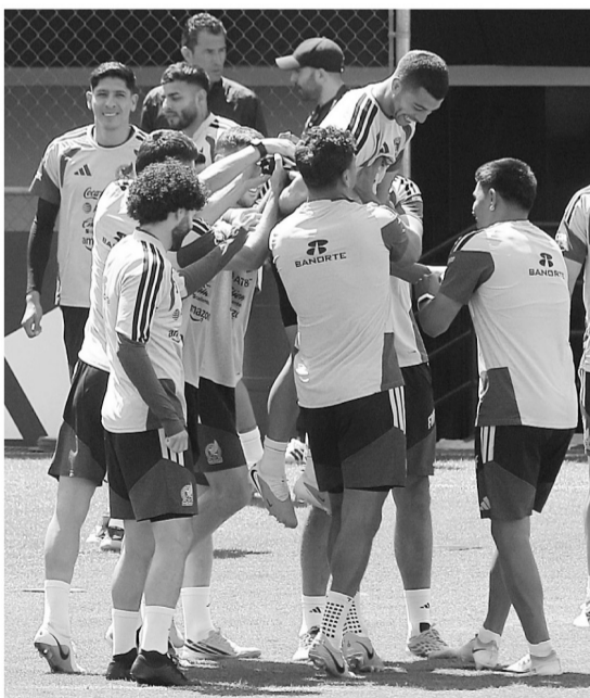
■ Lira recibió castigo de "calzón chino" por errar en un entrenamiento.

La Selección Mexicana se nota relajada. Ya habrá tiempo de ponerse seria, cuando en una semana dispute los Dieciseisavos de Final.