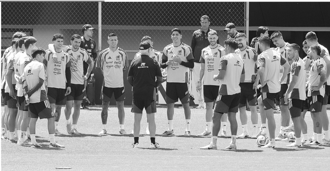
■ El grupo luce muy animado y con la confianza al tope tras asegurar su pase de ronda.

■ El partido del jueves 18 de junio, en el Estadio Guadalajara, entre México y Corea del Sur fue el encuentro más visto en lo que va del Siglo XXI con 25.5 millones de espectadores a nivel mundial, según datos de la FIFA.