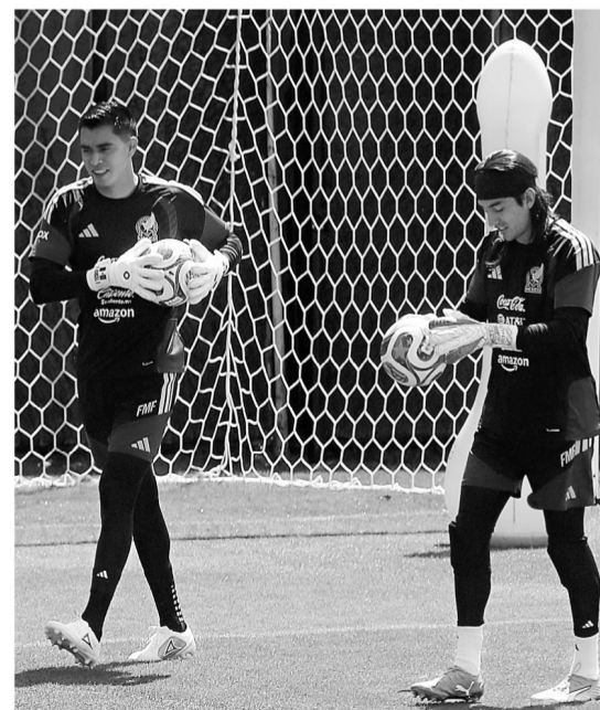
■ Los porteros tuvieron ejercicios de rapidez y reflejos.