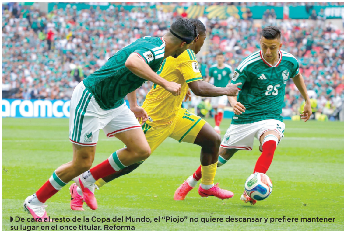
► De cara al resto de la Copa del Mundo, el "Piojo" no quiere descansar y prefiere mantener su lugar en el once titular. Reforma