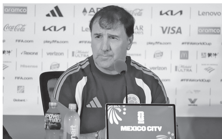
► El entrenador de Colombia pidió controlar las emociones y mantener la identidad del equipo frente a RD Congo. Reforma

Sería el mismo «Mosquito» Dembélé quien marcaría el tercero ante la débil marca de Irak, que cerrará el Grupo I frente a Senegal, mientras Francia, con 6 puntos, chocará con Noruega en el esperado duelo entre Mbappé y Erling Haaland.