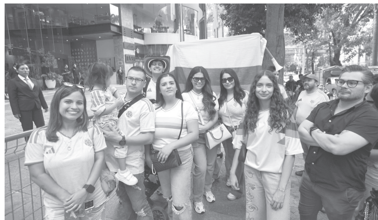
► La afición está lista para apoyar a su selección este martes en el estadio Guadalajara.