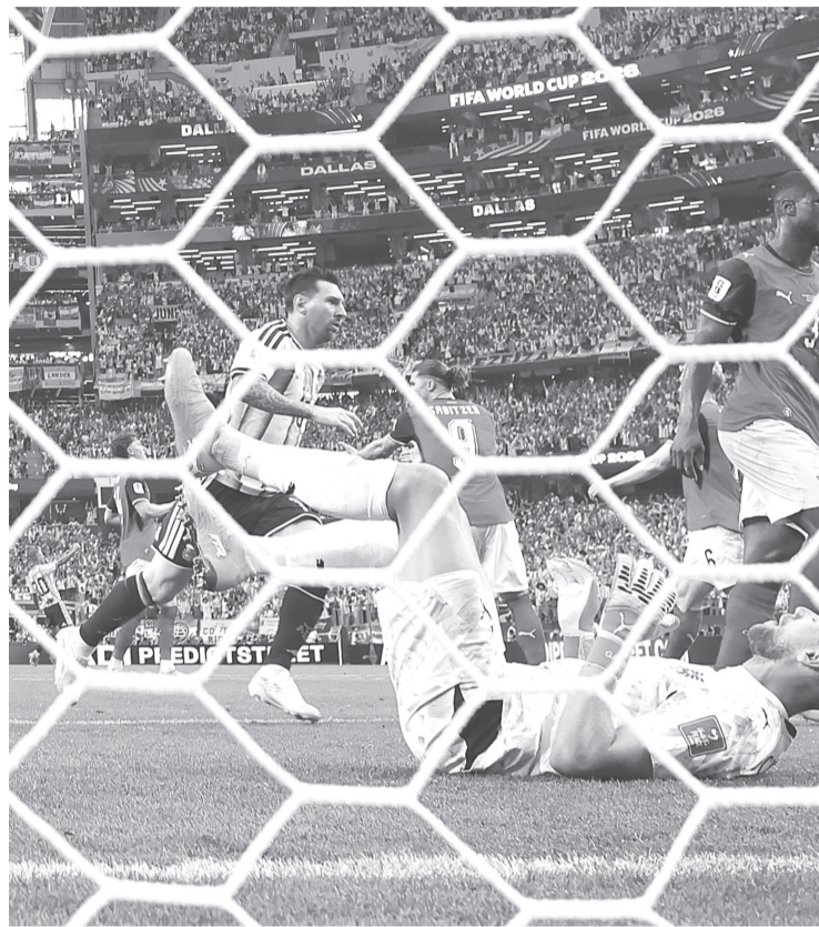
Con esta victoria, Argentina llega a 6 puntos y ocupa la cima del Grupo J, además de que aseguró su pase a los Dieciseisavos de Final.

Allí se instaló una pantalla gigante donde se transmiten los partidos de la Copa Mundial