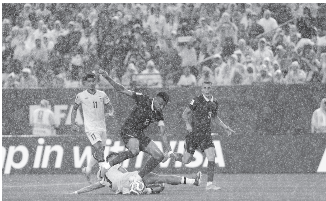
► Dembélé marcó el tercero ante la débil marca de Irak, que cerrará el Grupo I frente a Senegal.