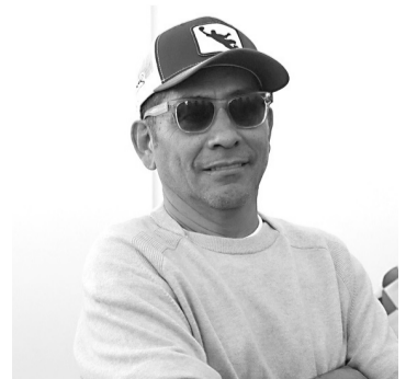
“Hay confianza, veo a los jóvenes cómo están comprometidos”, declaró.