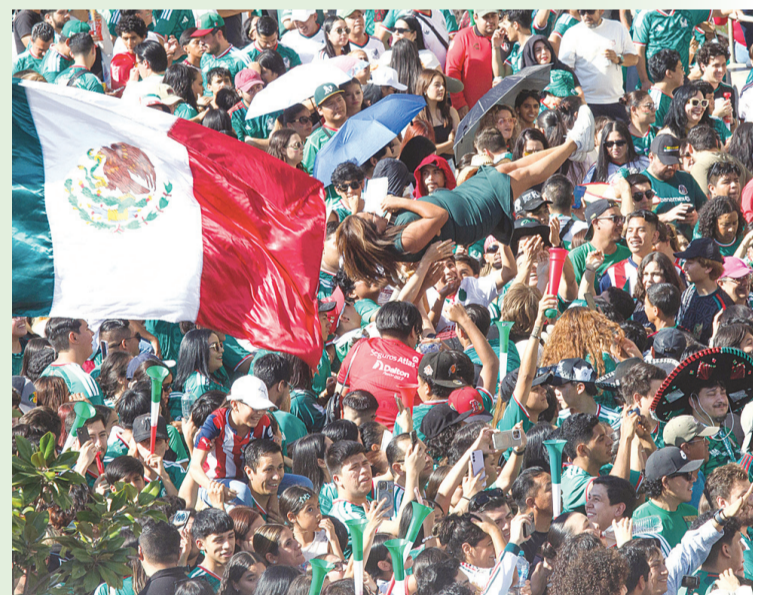
► El ambiente de fiesta duró horas en el FIFA Fan Festival de Guadalajara, donde los aficionados mexicanos aguardaron para el silbatazo inicial del encuentro ante Corea.