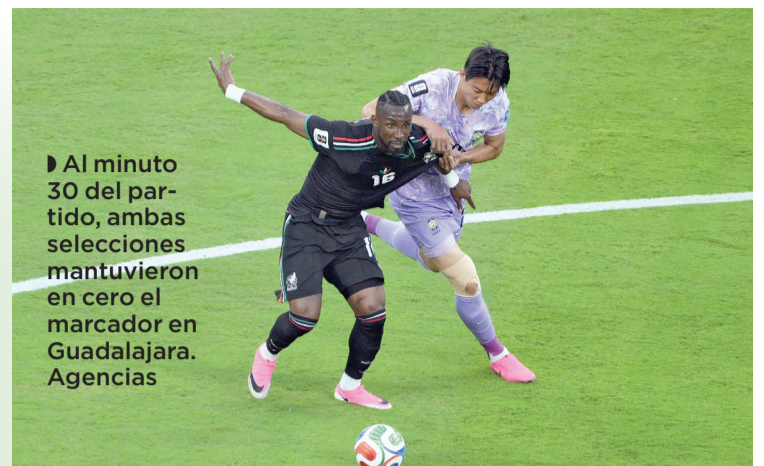
► Al minuto 30 del partido, ambas selecciones mantuvieron en cero el marcador en Guadalajara.