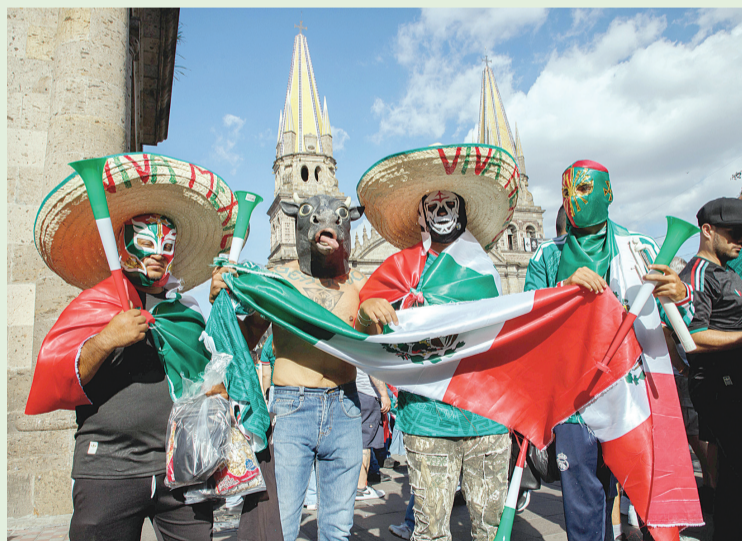
► Aficionados que no pudieron entrar al FIFA Fan Festival esperaron el partido de la selección en plaza Guadalajara y otros lugares aledaños.

"El son de la negra" resonó en el Estadio Guadalajara mientras 45 mil 522 aficionados vibraban con la anotación de Luis Romo en la cancha de Guadalajara