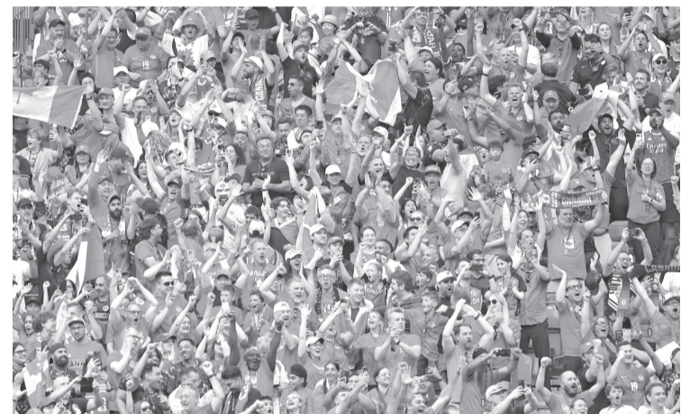
La afición canadiense aplaudió el accionar de su selección en la cancha. Agencias