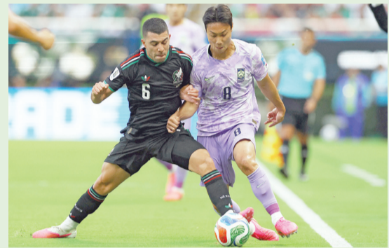
► Al medio tiempo, la posesión de balón fue de 56% para el Tricolor y 44% para los coreanos.