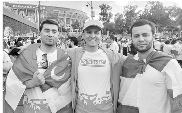
■ Pocos fans uzbekos se dieron cita para ver a su Selección.

Otros aficionados uzbekos reconocieron que quedaron en un grupo complicado con rivales de peso, iniciando con Colombia, una de las nominas con mayor promedio de edad de la Copa del Mundo, que fue totalmente local en la capital mexicana, pero podrán recordar por siempre que estuvieron presentes viendo a su Selección en un Mundial.