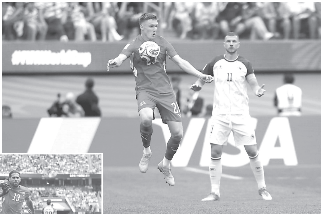
► Canadá brilló en la recta final del encuentro y lideró la goleada de Suiza sobre Bosnia y Herzegovina en el Sofi Stadium de Los Ángeles.

Con un doblete del juvenil Johan Manzambi y goles de Rubén Vargas y Granit Xhaka, la selección helvética goleó por 4-1 a Herzegovina para colocarse cerca de la clasificación a la siguiente ronda