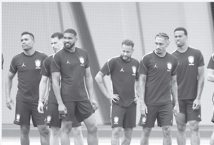
La prensa brasileña informó que el delantero del Santos permanecerá en Nueva Jersey y no viajará con el plantel entrenado por el italiano Carlo Ancelotti.

Por ese motivo, también está en duda la presencia de Neymar, de 34 años, en el úl-