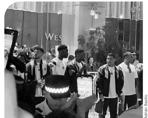
Más de 200 colombianos esperaron a su Selección en el hotel de concentración.

Algunos se acercaron a él para felicitarlo y también tomarse foto, pero eso sí sin soltar el ahora histórico y quizá ya artículo de interés para coleccionistas si Colombia trasciende en este Mundial para el que Erick ahorró varios años.