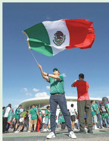
► La afición abarrotó las afueras del Estadio Guadalajara, en la jornada 2 del Mundial.

El liderato del Grupo A, pase lo que pase ante el miércoles Chequia, pondrá a Tricolor en la ruta del Estadio Ciudad de México tanto en Dieciseisavos como en Octavos, en caso de avanzar.