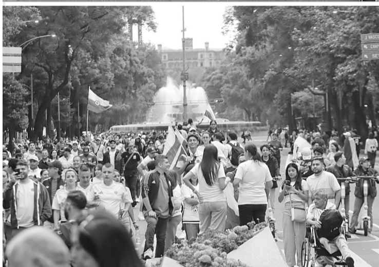
Los aficionados colombianos vitorearon a sus ídolos, sobre todo a James Rodríguez.