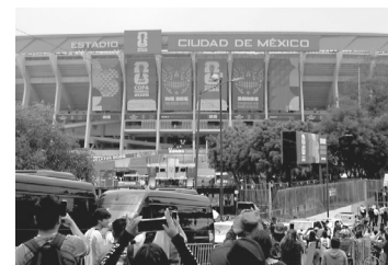
■ Los vecinos aseguran que las medidas son mucho más estrictas ahora. Reforma

Con varios partidos aún por disputarse, los habitantes prevén que los problemas continuarán el resto del mundial. Mientras miles de aficionados disfrutaban de la fiesta futbolística.