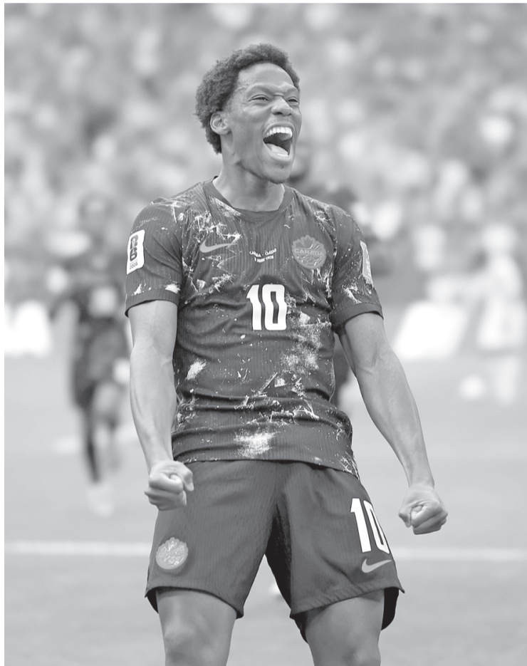
Con el triunfo, Canadá se posicionó primero del Grupo B con 4 puntos, los mismos que Suiza, pero con mejor diferencia.

Nunca antes la selección canadiense había derrotado a un rival, en las ediciones en las que participó de México 86 y Qatar 2022