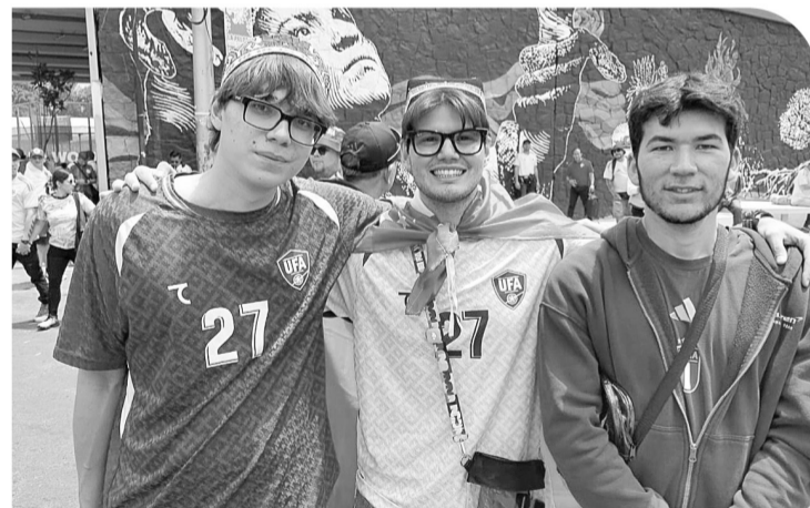
■ La afición de Uzbekistan se sintió feliz por debutar en el Mundial.