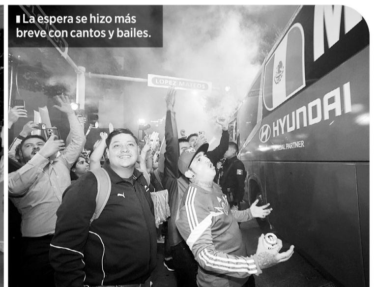
La espera se hizo más breve con cantos y bailes.

Entre trompetas, tambores y gargantas entregadas al canto, sonaron el "Cielito Lindo", "México Lindo y Querido" y hasta "Guadalajara", acompañada por el mariachi. Tam-