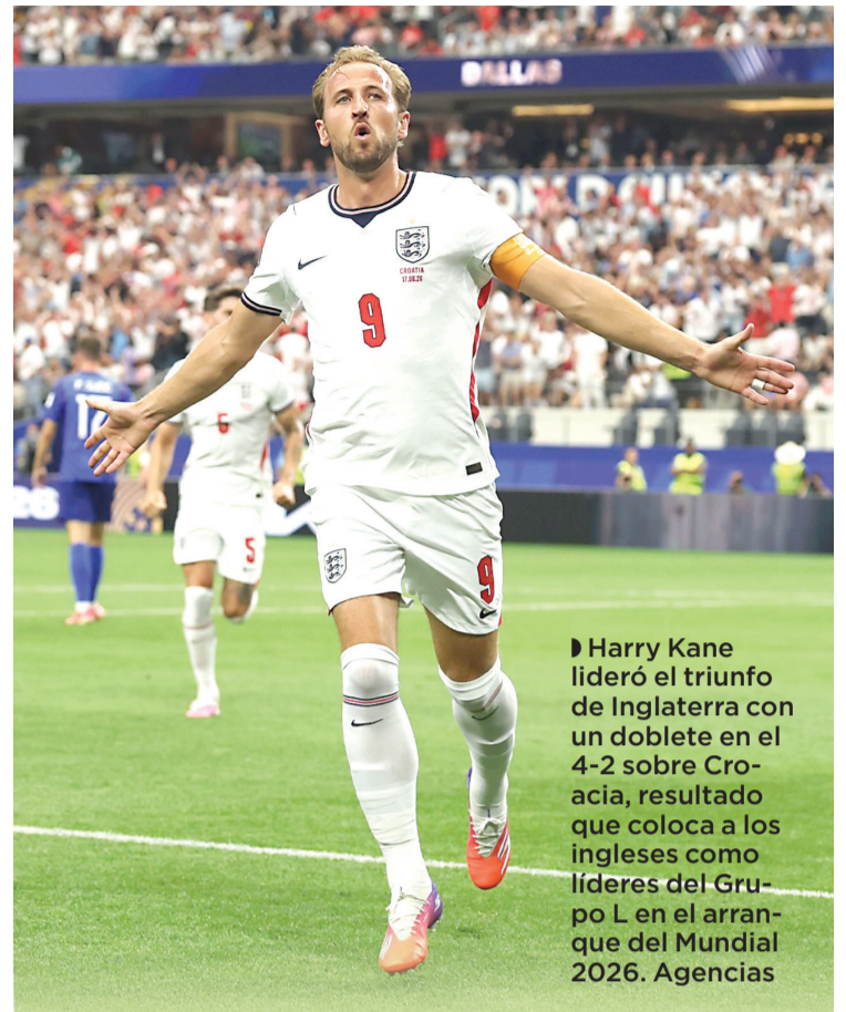
Harry Kane lideró el triunfo de Inglaterra con un doblete en el 4-2 sobre Croacia, resultado que coloca a los ingleses como líderes del Grupo L en el arranque del Mundial 2026.