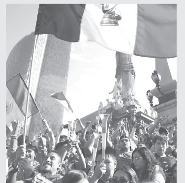
► Las medidas fueron publicadas en el "Diario Oficial de la Federación" y contemplan esquemas obligatorios de teletrabajo en dependencias federales. Reforma

También se suspenderán durante toda la jornada las actividades escolares en planteles públicos y privados de educación básica, media superior y superior ubicados en la zona metropolitana tapatía.