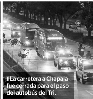
■ La carretera a Chapala fue cerrada para el paso del autobús del Tri.