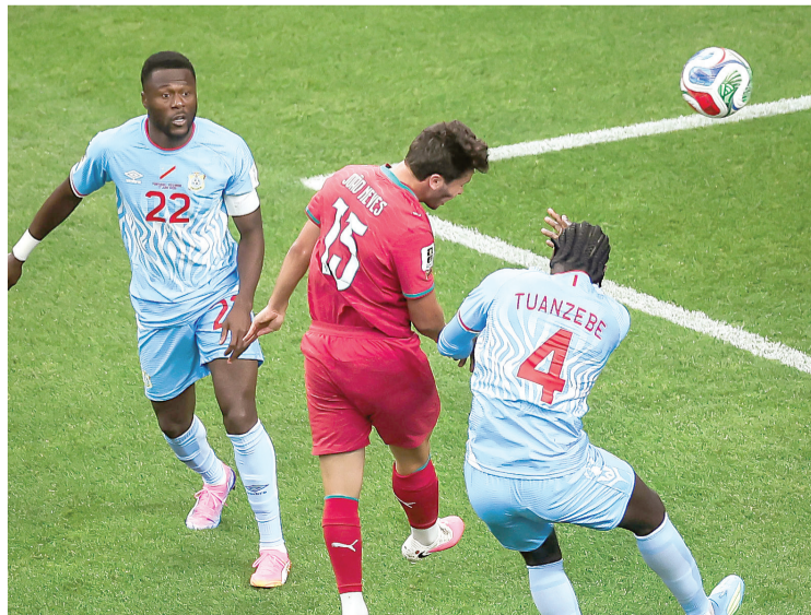
Con el empate, ambos países suman un punto en la competencia.

GOLES JOAO NEVES (6' POR) YOANE WISSA (45+2' POR)