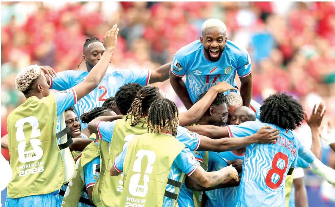
Los del Congo sorprendieron a Portugal en el debut de ambos equipos en la Copa del Mundo 2026.