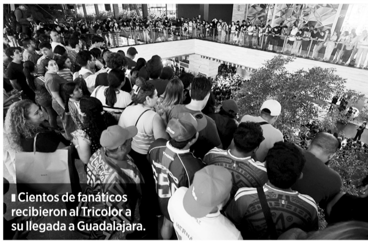
■ Cientos de fanáticos recibieron al Tricolor a su llegada a Guadalajara.

Porque al Tricolor se le cuestiona durante buena parte del proceso mundialista, pero apenas rueda la pelota en una Copa del Mundo, la afición demuestra que, si la buena vibra sumara puntos, México pelearía sin problema por el campeonato del mundo.