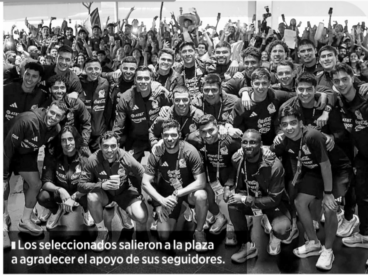
■ Los seleccionados salieron a la plaza a agradecer el apoyo de sus seguidores.