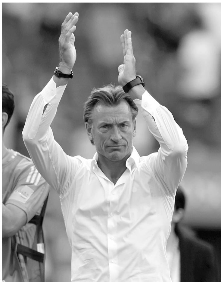
El debut de Renard será el sábado 20, cuando Túnez enfrente a Japón por la segunda fecha del Grupo F del mundial. Agencias

El debut de Renard será el sábado 20, cuando Túnez enfrente a Japón por la segunda fecha del Grupo F del Mundial 2026, en la que Países Bajos, que igualó 2-2 con los nipones en la jornada inaugural, se medirá el mismo día con Suecia.