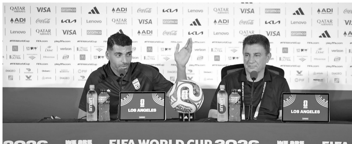
Los problemas administrativos continúan para la selección iraní.

El estratega de la selección recordó que el equipo ya había sufrido complicaciones antes del torneo, luego de que Estados Unidos negara las visas a 15 integrantes de la delegación