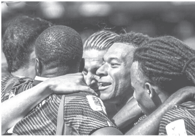
► A la selección de Francia le costó trabajo inclinar la balanza ante Senegal, aunque logró un triunfo 3-1 con doblete de Kylian Mbappé.

Senegal nunca dejó de competir y buscó acortar distancias hasta el final. Su esfuerzo tuvo recompensa en el tiempo de compensación, cuando Ibrahim Mbaye aprovechó un descuido defensivo para marcar el gol del descuento y