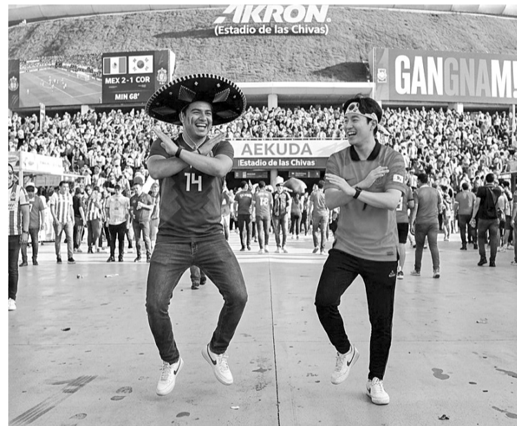
Los coordinadores del evento determinan que la explanada principal del estadio Akron albergará la concentración masiva de los fanáticos.

Las pautas logísticas distribuidas en internet sugieren que los participantes comiencen a congregarse tres horas antes del partido, permitiendo que las autoridades de seguridad y vialidad locales (pertenecientes al gobierno del Estado de Jalisco) mantengan los perímetros despejados para el libre tránsito y la correcta ejecución del baile temático.