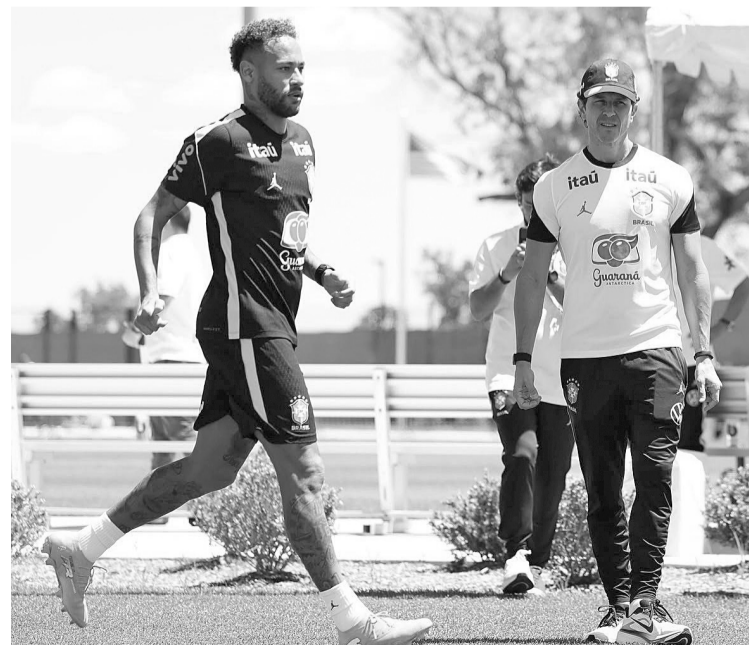
El brasileño hizo algunos movimientos en el campo de juego en Nueva Jersey.

"Rezamos para que esté al cien por ciento, porque cuando esté al cien por ciento, será alguien que nos podrá ayudar mucho", completó Douglas Santos sobre el eventual retorno de Neymar a la "canarinha", que recibió al menos 1 gol en sus últimos 6 partidos.