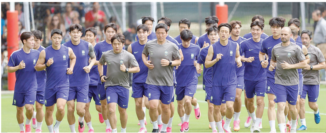
Corea del Sur entrenó ayer en Verde Valle rumbo al duelo ante México.