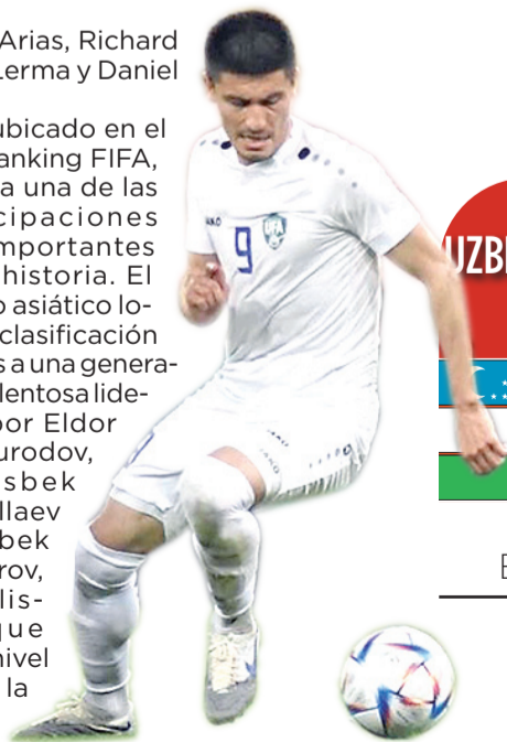
PARTIDO GRUPO K