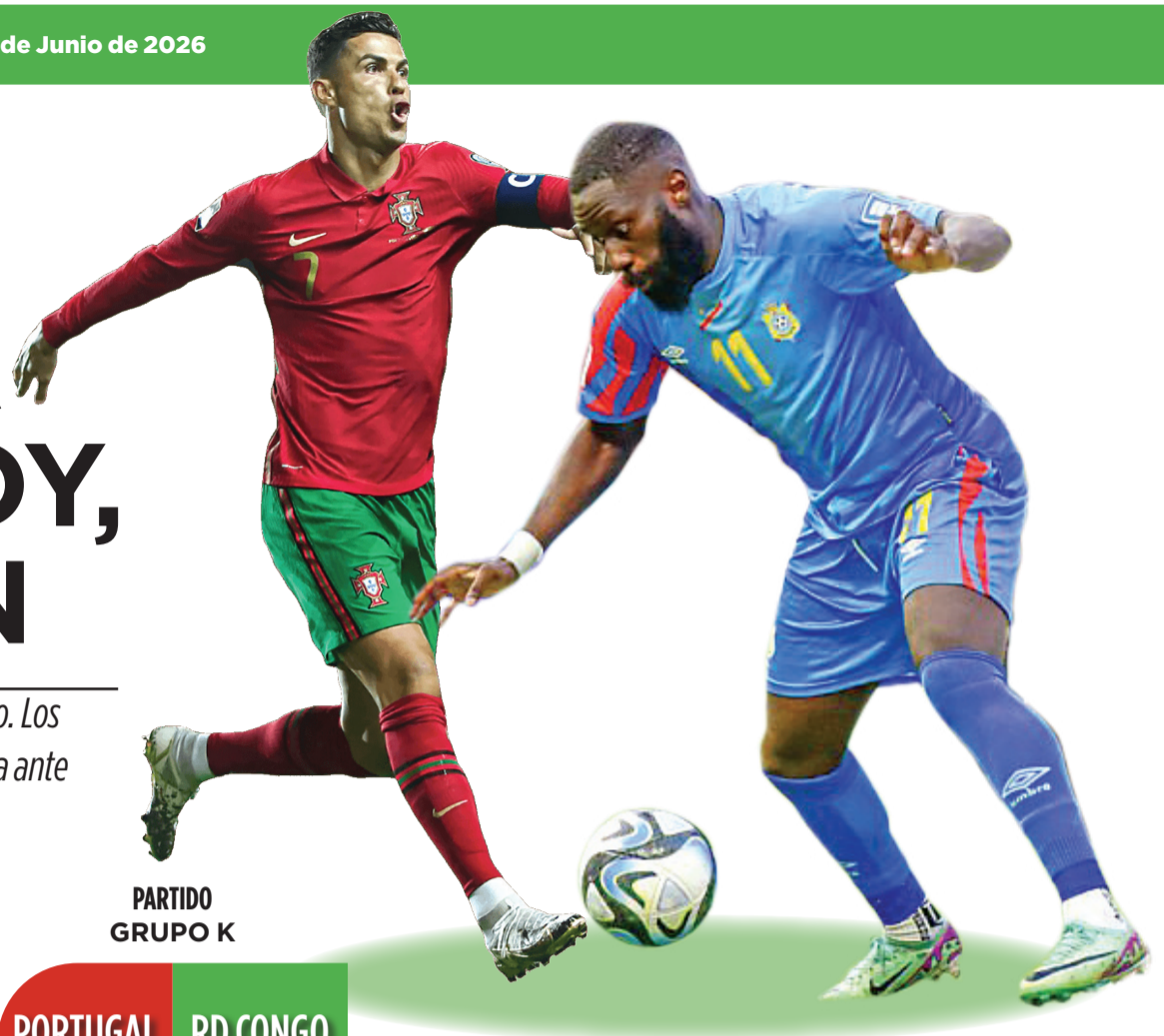
PARTIDO GRUPO K

En cuanto a valores de mercado, Portugal presenta una de las plantillas más valiosas del torneo, de acuerdo con Trans-