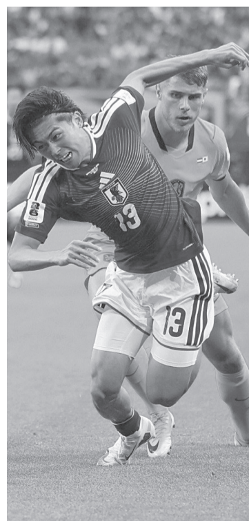
► Países Bajos se adelantó en dos ocasiones, pero Japón reaccionó para rescatar un valioso empate 2-2 en Arlington.

Con buen Fútbol y muchos goles, así arrancó Houston el Mundial, presenciando el potencial alemán.