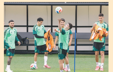
Los ejercicios incluyeron estiramientos, entrada en calor, ejercicios con vallas y obstáculos. Reforma

cicios que el cuerpo técnico de Javier Aguirre designó a los futbolistas incluyeron estiramientos, entrada en calor, ejercicios con vallas y obstáculos, además de que practicaron pases en grupos de tres, con la intención de mejorar la velocidad, control y visión. Tuvieron dinámicas de choque con pelotas de gimnasio, para simular escenarios de partido.