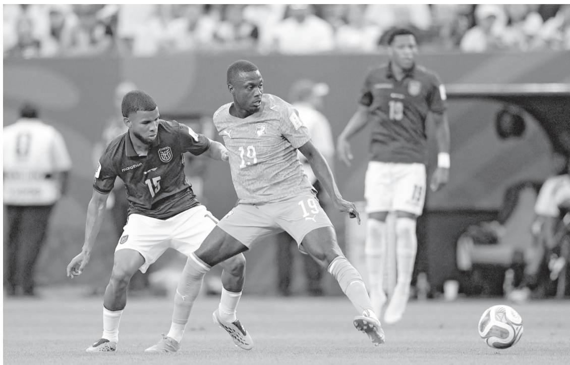
Costa de Marfil sigue demostrando su muralla defensiva, ya que solo recibió un gol en los amistosos de preparación al certamen mundialista.