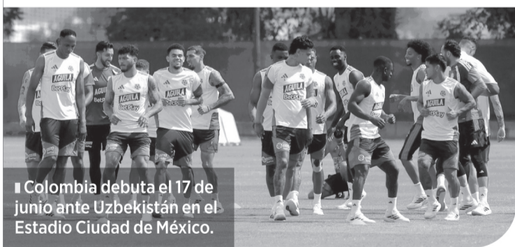
Colombia debuta el 17 de junio ante Uzbekistán en el Estadio Ciudad de México.

“San Camilo” y compañía regresarán a tierras tapatías para disputar su segundo compromiso mundialista ante la República Democrática del Congo el 23 de junio, también a las 20:00 horas, en el Estadio Guadalajara, antes de viajar a Miami para cerrar el Grupo K frente a Cristiano Ronaldo y Portugal.