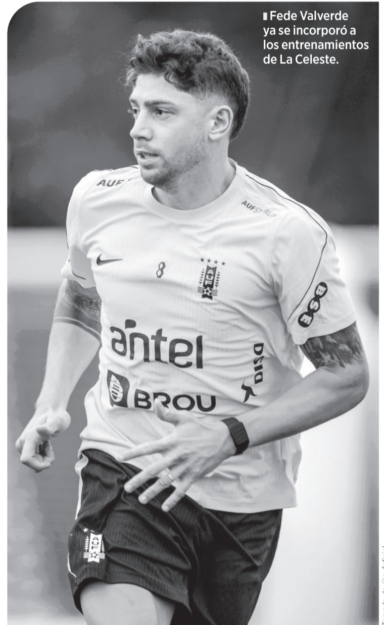
Fede Valverde ya se incorporó a los entrenamientos de La Celeste.

A partir de hoy, el FIFA Fan Festival de Miami, ubicado en Bayfront Park, abrirá sus puertas a miles de visitantes, entre ellos parte de la comunidad uruguaya, que podrá observar los dos primeros partidos de La Celeste en la ciudad donde radica.