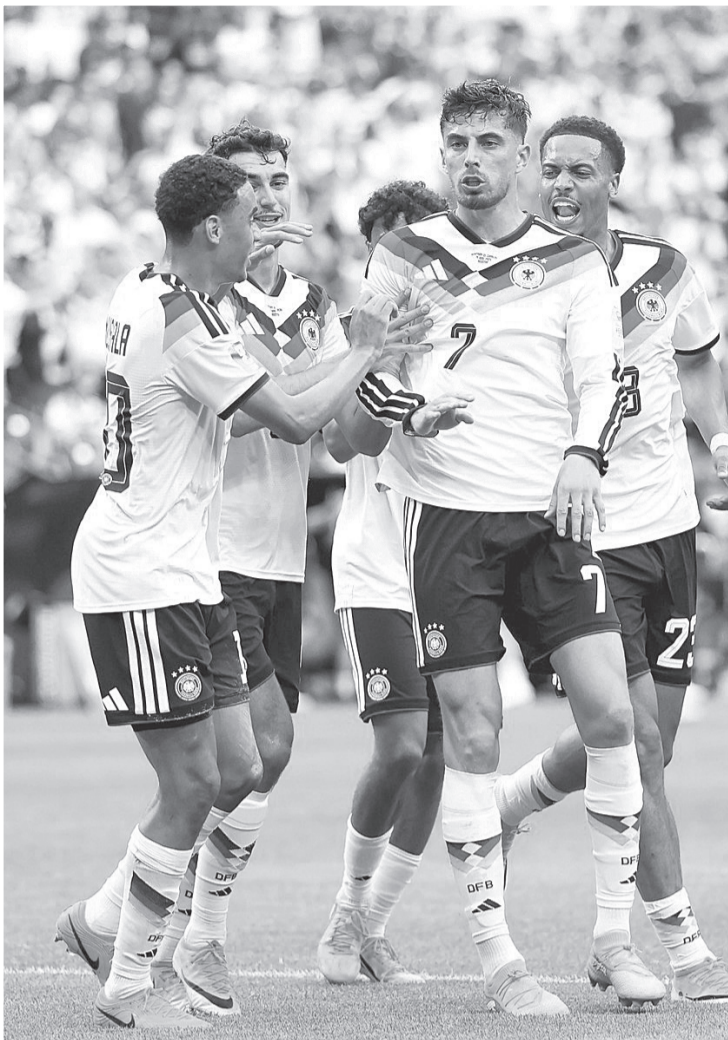
► Kai Havertz marcó un doblete y encabezó la goleada de Alemania sobre Curazao, en una exhibición de poderío ofensivo durante su debut en la Copa del Mundo 2026. Agencias

Brown cobró un corner al movimiento del zaguero Nico Schlotterbeck quien se sacudió su marca y remató para el 2-1 al minuto 37.