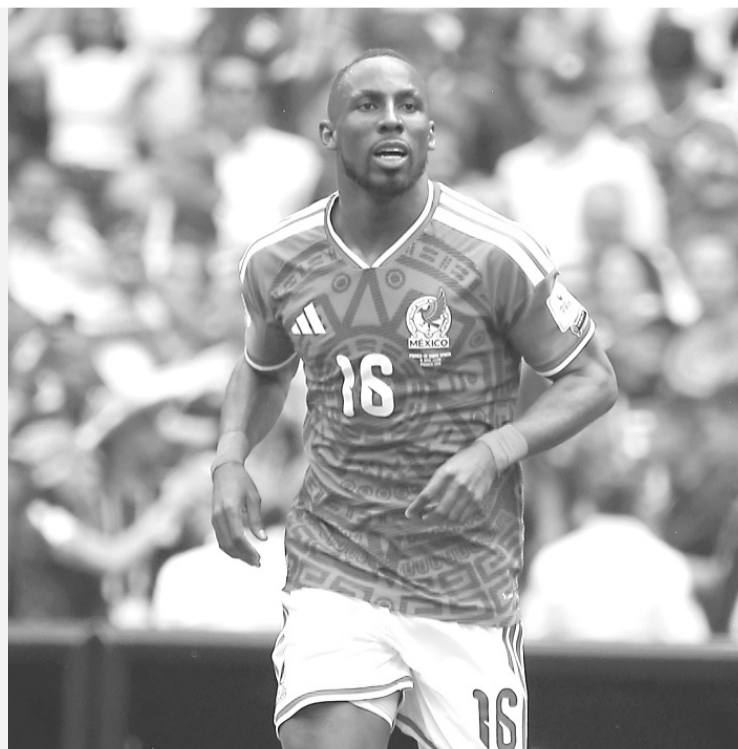
► Julián Quiñones celebra el gol que abrió el camino de México ante Sudáfrica en el Mundial 2026.

Una versión que cobró aún más fuerza tras las palabras de Ramón Jesurún, presidente de la Federación Colombiana de Fútbol, quien reveló en una entrevista reciente que el combinado cafetalero hizo múltiples intentos por integrarlo a su proyecto. Sin embargo, pese al interés insistente, el delantero se mantuvo firme en su decisión y terminó por declinar la propuesta.