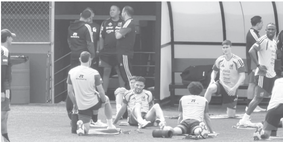
► Los delanteros hicieron su grupito en el entrenamiento matutino del Tri este sábado, a cinco días del partido ante Corea del Sur.

Por ahora esta dupla solo se ha dado fuera del campo,