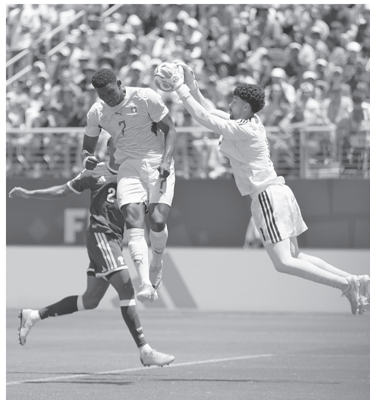
► Suiza dominó gran parte del encuentro y generó numerosas oportunidades, pero no logró ampliar la ventaja y terminó cediendo el empate en los minutos finales.