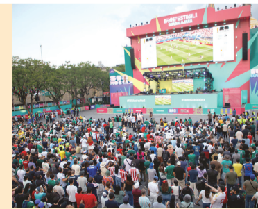
■ La lluvia apagó las pantallas, vació la plaza y dejó la fiesta mundialista en pausa, al menos por una noche.

“Venimos de Paraguay para disfrutar del Mundial, de la cordialidad de la gente; se disfruta muchísimo a pesar del resultado”, comentó el fan guaraní Marcos.