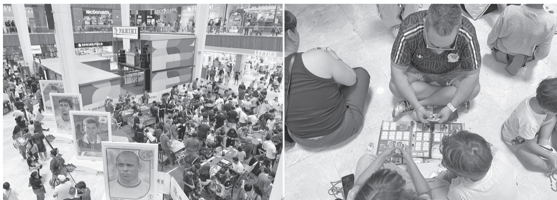
■ Entre mesas, carpetas y montones de repetidas, la pregunta más frecuente suele ser la misma: "¿Cuál te falta?". Reforma

Completar una selección, encontrar al jugador más buscado o pegar esa estampa que parecía inalcanzable convierte el álbum mundialista en todo un desafío para miles de aficionados.