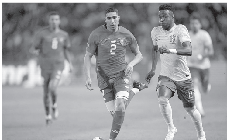
► En la segunda mitad del cotejo, ambos se fueron al frente pero dominó Brasil.