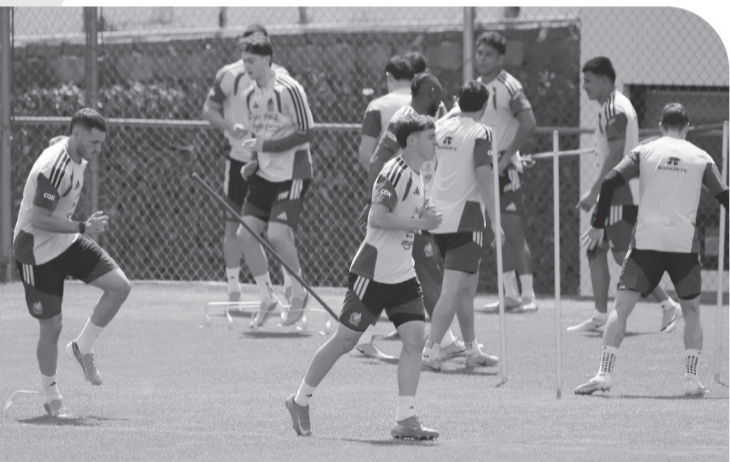
■ México tuvo sesión regenerativa ayer tras la victoria del jueves.

Aunque sufrió por su derrota ante Suecia en el último partido de Fase de Grupos, finalmente el Tri obtuvo su boleto como segundo lugar a Octavos de Final, instancia en la que cayó frente a Brasil.