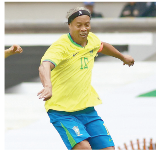
■ Dinho apuesta por Brasil en el Mundial, como cuando él se coronó en 2002 con la Canarinha.

ticipaciones en pasarelas de muchas cosas, entonces estoy muy contento por todo esto”, mencionó.