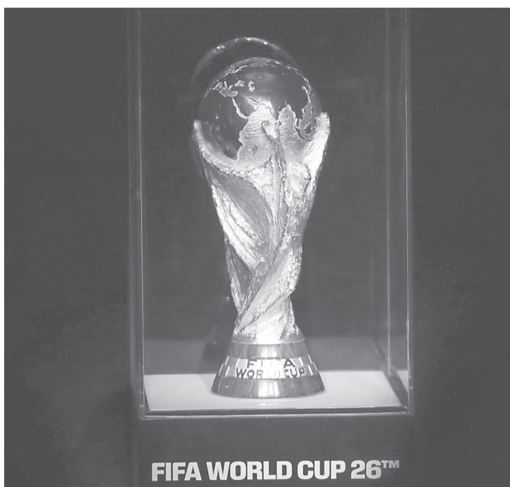
FIFA WORLD CUP 26™

Será la segunda ocasión, después de que en 2010 Andrés Iniesta hizo historia con su gol contra Países Bajos. Los españoles querrán olvidar la derrota contra Portugal en la final de la Liga de las Naciones UEFA en 2025, y la eliminación en Octavos en el Mundial de Catar 2022, para empaparse de un ADN que los consagre otra vez. Pero, paso a paso, primero tendrán que medirse en Atlanta, Estados Unidos, contra Cabo Verde, Arabia Saudita y contra la “Garra Charrúa”, Uruguay.