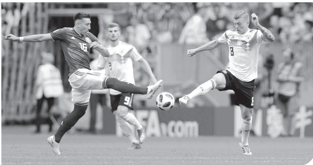
■ Todos los debuts triunfales del Tricolor tuvieron el boleto a siguiente fase como recompensa.

Gracias a un penal de Cuauhtémoc Blanco, México se impuso 1-0 a Croacia en su primer partido de la justa de 2002. El Tri, dirigido por Javier Aguirre, terminó invicto esa Fase de Grupos y clasificó a Octavos como primer lugar de su sector con 7 puntos, para después ser eliminado por EU.