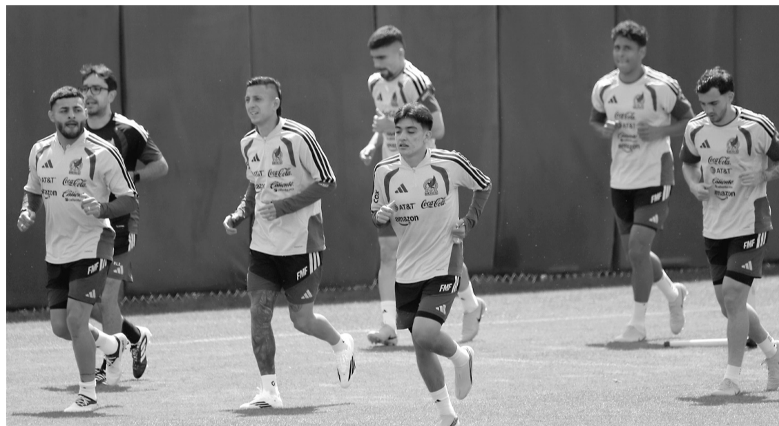
► Javier Aguirre tomó a una selección mexicana en ruinas, pero construyó un equipo que acaricia el liderato del Grupo A y, con ello, una ruta favorable en el mundial.

42 ENTRENAMIENTOS realizó la Selección Mexicana desde enero y hasta el 11 de junio.