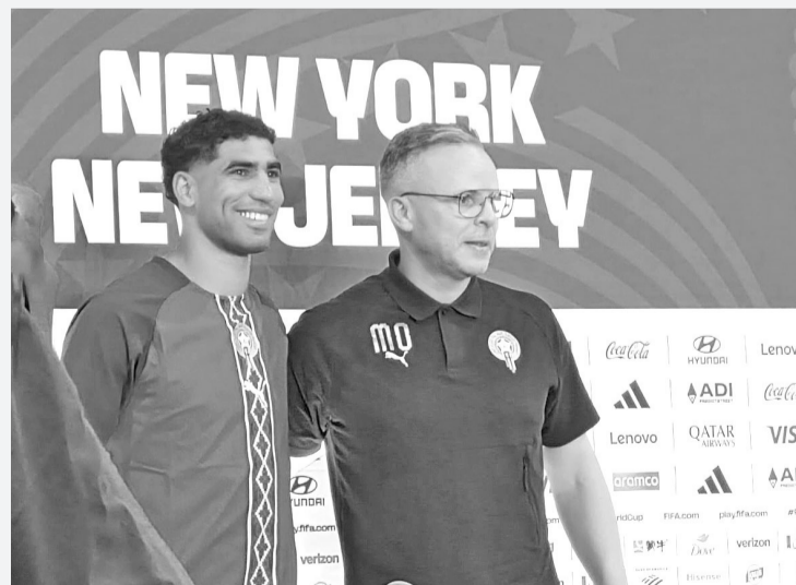
► Hakimi dijo que ni Vinicius ni Neymar intimidan a la selección marroquí.

quiero porque me gusta enfrentar a los mejores del mundo, así que me gustaría que