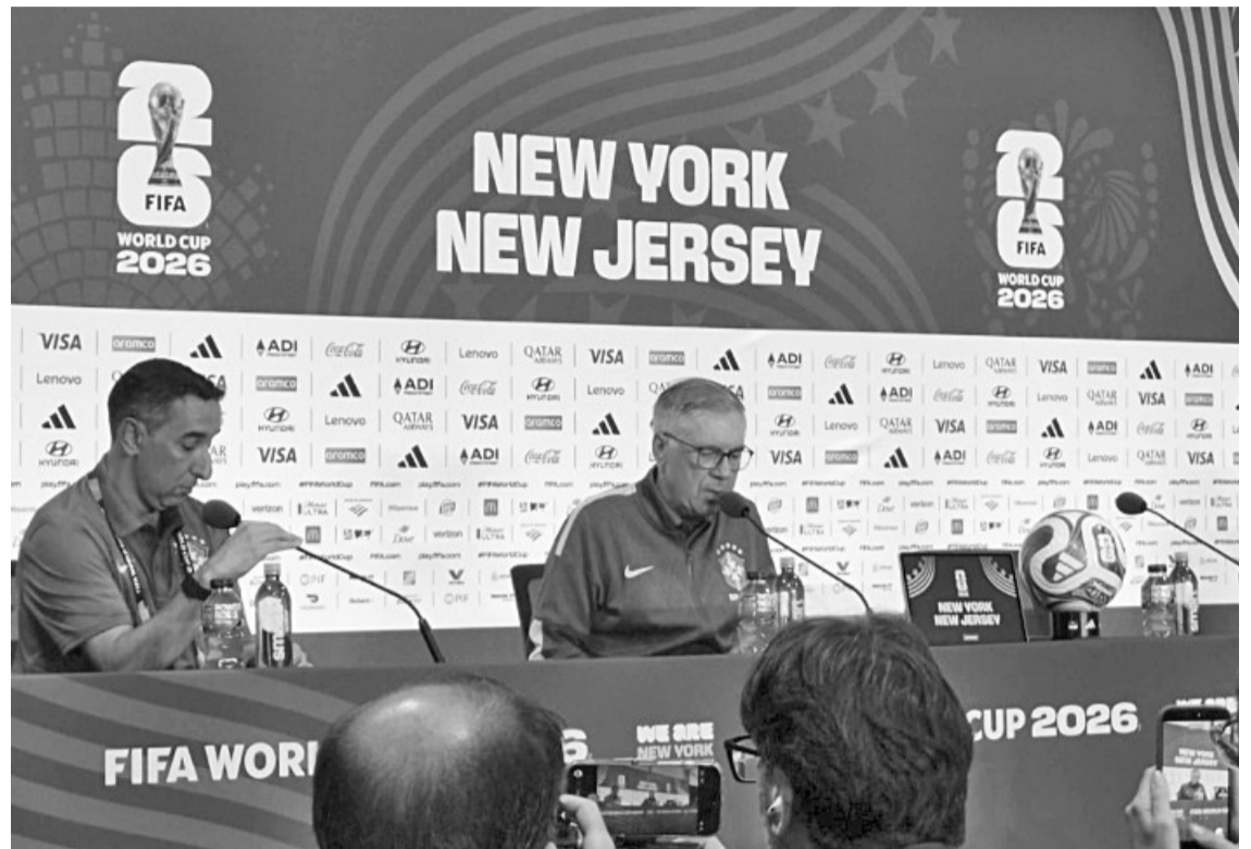
► Carlo Ancelotti, DT de Brasil, en su primera experiencia mundialista como estratega, dando conferencia en Nueva Jersey, EE. UU.

El exentrenador del Real Madrid aclaró que Brasil no solo es un equipo que sabe qué hacer con el balón en su poder, sino también jugar de la manera más aplicada cuando no lo tiene, y el ejemplo podría verse ante el combinado marroquí, al que