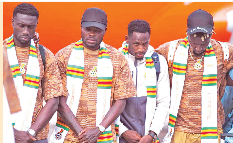
► Ghana se alista para su debut en el Mundial. Reforma

En las leyes del gobierno de Canadá se establece que se le puede negar el acceso a aquellas personas que han cometido o que han sido condenadas por un delito.