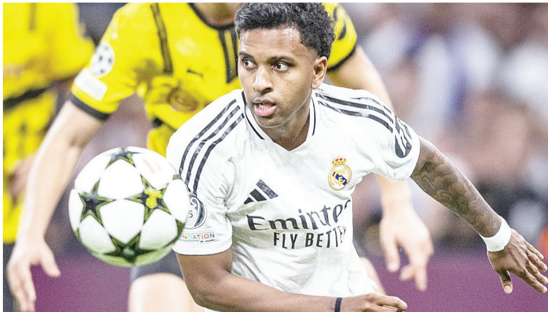
► Rodrygo Goes sufrió una grave rotura del ligamento cruzado anterior y del menisco externo de la pierna derecha. Reforma

En la lista figuran campeones continentales y jóvenes estrellas, que atraviesan el mejor momento de sus carreras.