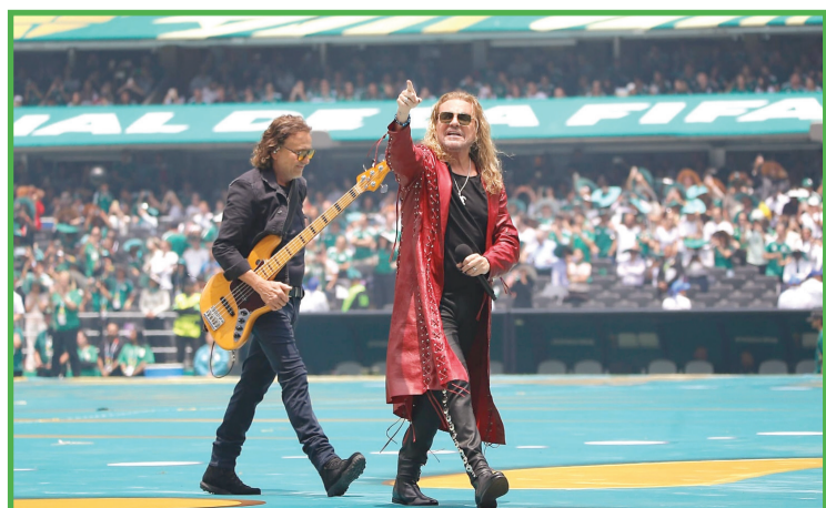
El grupo musical Maná fue el encargado de abrir la presentación de los artistas. Reforma