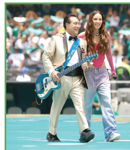
Belinda con los Ángeles Azules en la inauguración del Mundial 2026. Reforma