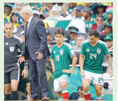
De cara al duelo ante Corea del Sur, subrayó la necesidad de afinar la contundencia.