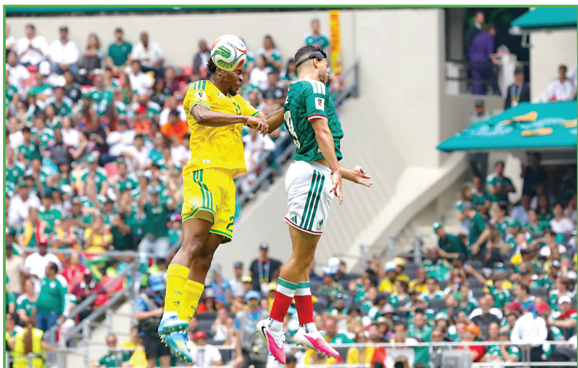
► La victoria rompió una racha de siete partidos inaugurales de mundial sin triunfo para México.