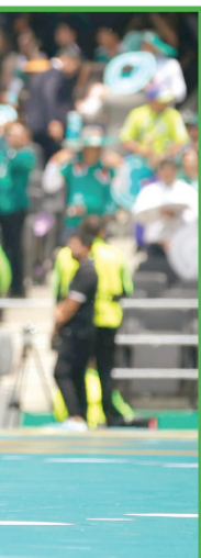
el concierto de...