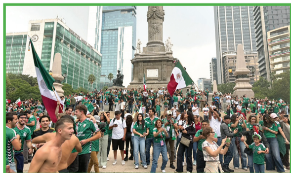
► Como ya es costumbre para los mexicanos, el festejo del triunfo de un partido del Tricolor se celebra en las inmediaciones del Ángel de la Independencia. Reforma