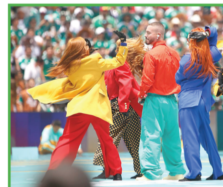
Danny Ocean, J Balvin (naranja) y Lila Downs participaron en el show musical.