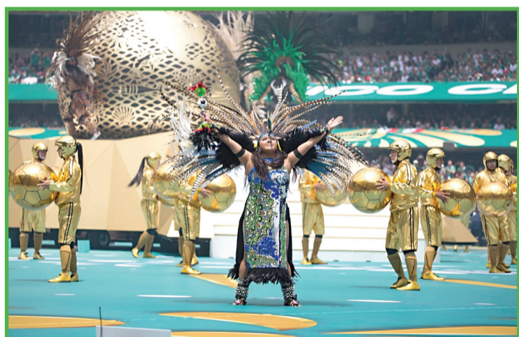
Personajes con motivos prehispánicos participaron en la ceremonia inaugural de la Copa del Mundo.

El nueve de la selección nacional remató dentro del área chica un centro de Roberto Alvarado para terminar con su sequía sin gol en Copa del