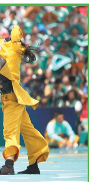
Lila Downs fue...

Luego, ya con el ingreso de los futbolistas de Sudáfrica llegaron miles de abucheos por parte de una fanática mexicana que quiso comenzar a hacerse pesar en contra del rival desde antes del silbatazo inicial del primer partido de la Copa del Mundo 2026.