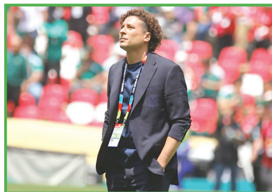
Guillermo Ochoa fue recibido entre aplausos y ovaciones por la afición en las gradas del estadio.