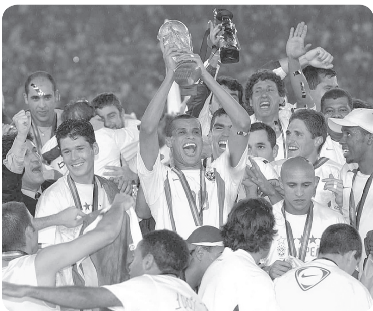
El torneo ha producido algunos de los momentos más memorables de la historia del deporte mundial. Agencias

Considerado uno de los mejores finales de la historia: Argentina de Lionel Messi venció a Francia en penales y logró su primera copa.