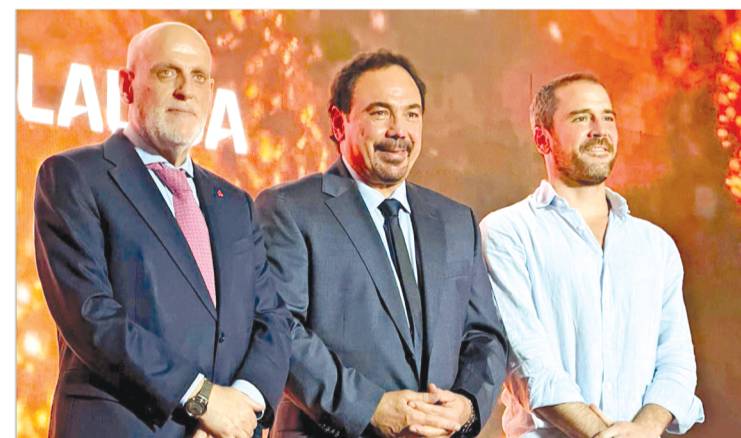
■ Hugo Sánchez (centro) estuvo en la presentación de la experiencia Legends junto a Javier Tebas (izq.), presidente de LaLiga.

“Yo apoyo a Javier (Aguirre) con lo que ha elegido. Espero que en los partidos hayan más ocasiones claras de gol, eso es lo que vengo comentando. Como delantero deseo que hayan más jugadas por banda y que surtiéramos con muchos centros a los delanteros para que puedan mostrarse más. Ojalá que los delanteros puedan sobresalir, juegue quien juegue”, destacó Hugo.